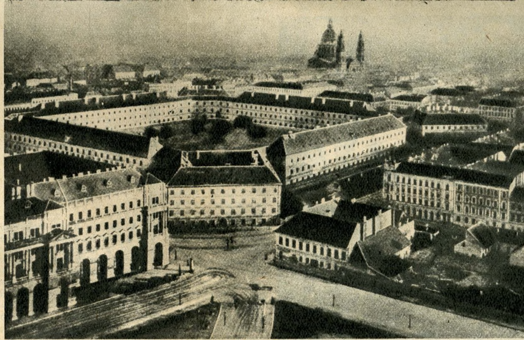
A hírhedt »új épület« a mai Szabadság tér helyén