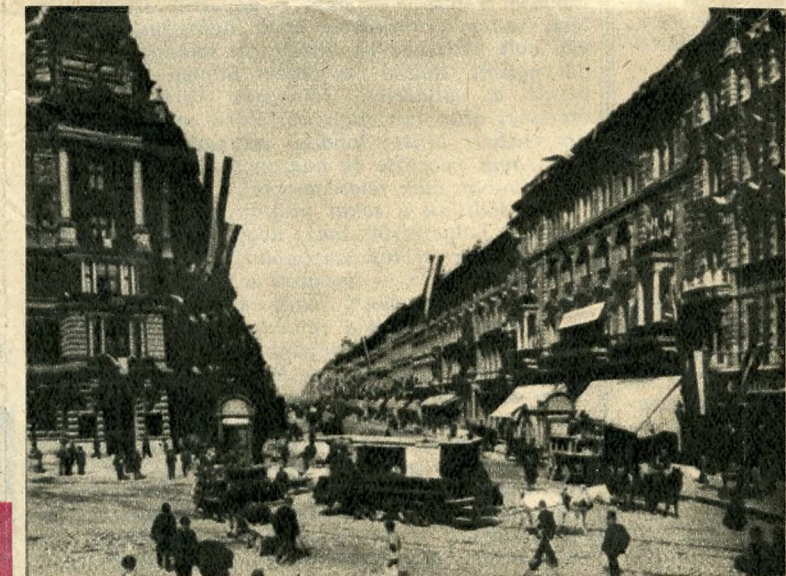
Utcakép a századforduló Budapestjéről