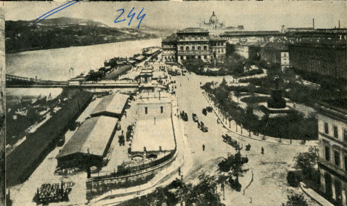
A mai Roosevelt tér 50 évvel ezelőtt