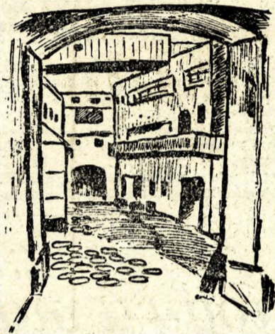
A Goldberger-gyár régi traktusa