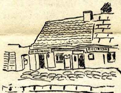
Öreg óbudai ház

A szakértők azt mondják, Óbudán nem tenni két kapavágást, hogy valami ókori emlékek elő ne bukkanjanak a föld alól. A Margithidtól Pünkösdfürdőig, a Hajógyári szigetől a