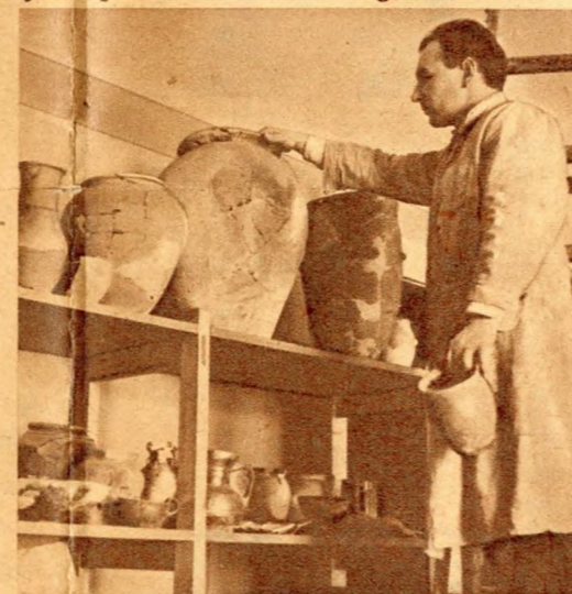
Összetört cserepekből kincset érő régiséget ragasztanak össze