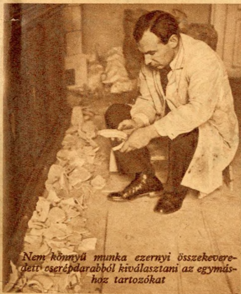
Nem könnyű munka ezernyi összekevert cserépdarabból kiválasztani az egymáshoz tartozókat

A Tabánban, Budapest környékén és a Gellérthegy déli lejtőjén folytatott ásatások gazdag régészeti anyagot hoztak felszínre. Különböző népek művelődésének dokumentumai rétegenként fekszenek itt a földben. A csiszolt kőkorszaktól kezdve a késői vaskor kultúrájáig majdnem minden közbeeső művelődés szerszámai, használati tárgyai szerepelnek a kiásott anyagban. Tabáni kultúrának nevezik gyűjtőnéven a Tabán és Gellérthegy környéki gazdag lelőhelyek régészeti anyagát. A főváros Régészeti Intézetébe szállítják az ásatások legkisebb darabját is és ott a legmodernebb tudományos módszerek segítségével dolgozzák fel az anyagot. Tompa Ferenc és Nagy Lajos egyetemi tanárok, Dr. Nagy Tibor asszisztens és Domján Árpád szobrász-restaurátor gondos vizsgálatok és tanulmányok után állítják össze egy kétezres év előtti régi kultúra szerszámainak és fejlett izlésű agyagtárgyainak