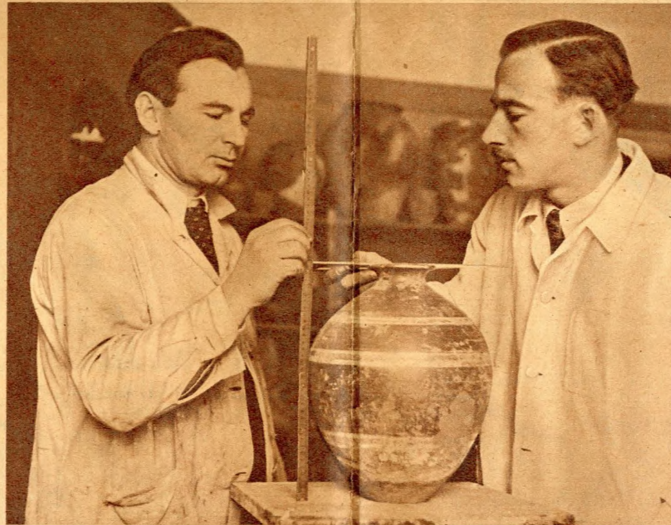
A késői vaskorból származó teljesen ép kőkorsón méréseket végeznek