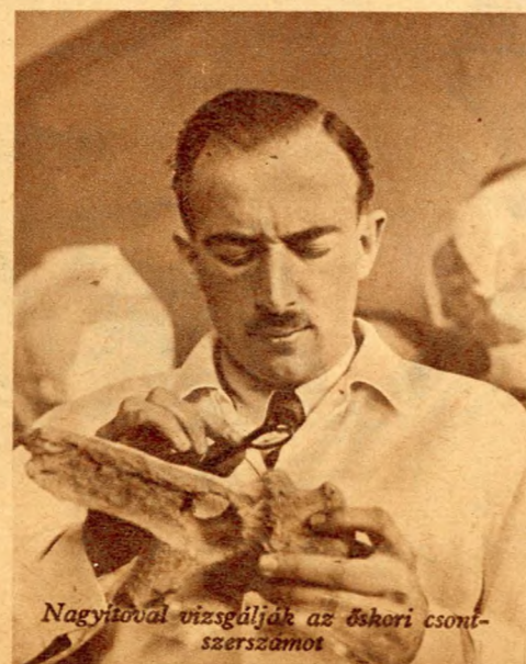
Nagyítóval vizsgálják az őshori csontszerszámot