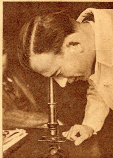
Mikroszkóppal állapítják meg az edények anyagának összetételét