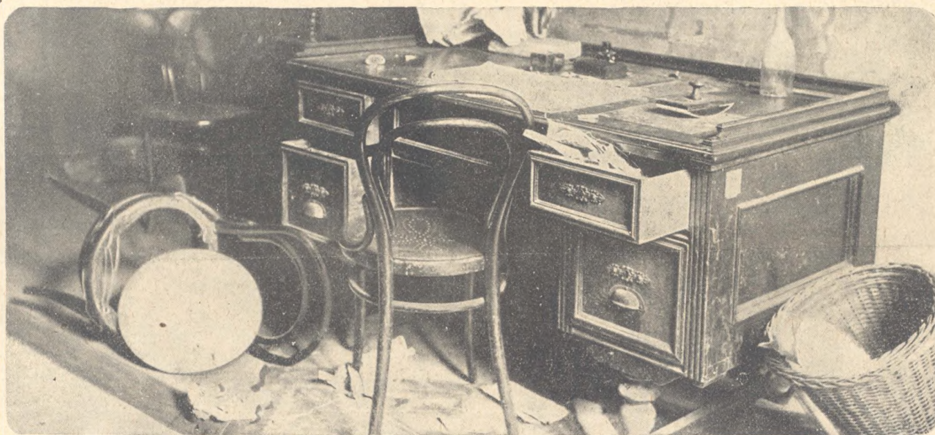
Képek a főpostáról. A felső képen hivatalos bizottság konstatalja, hogy a románok az entente-missziók címére érkezett levélzsákokat is visszatartották. Középső képünkön annak a teremnek egy részlete látható, ahová a románok bedobálták az érkező levélzsákokat, melyeknek tartalmát nem engedték kézbesíteni. Alsó kép: A főpostára beosztott román cenzura ilyen állapotban hagyta «hivatalos helyiségét».