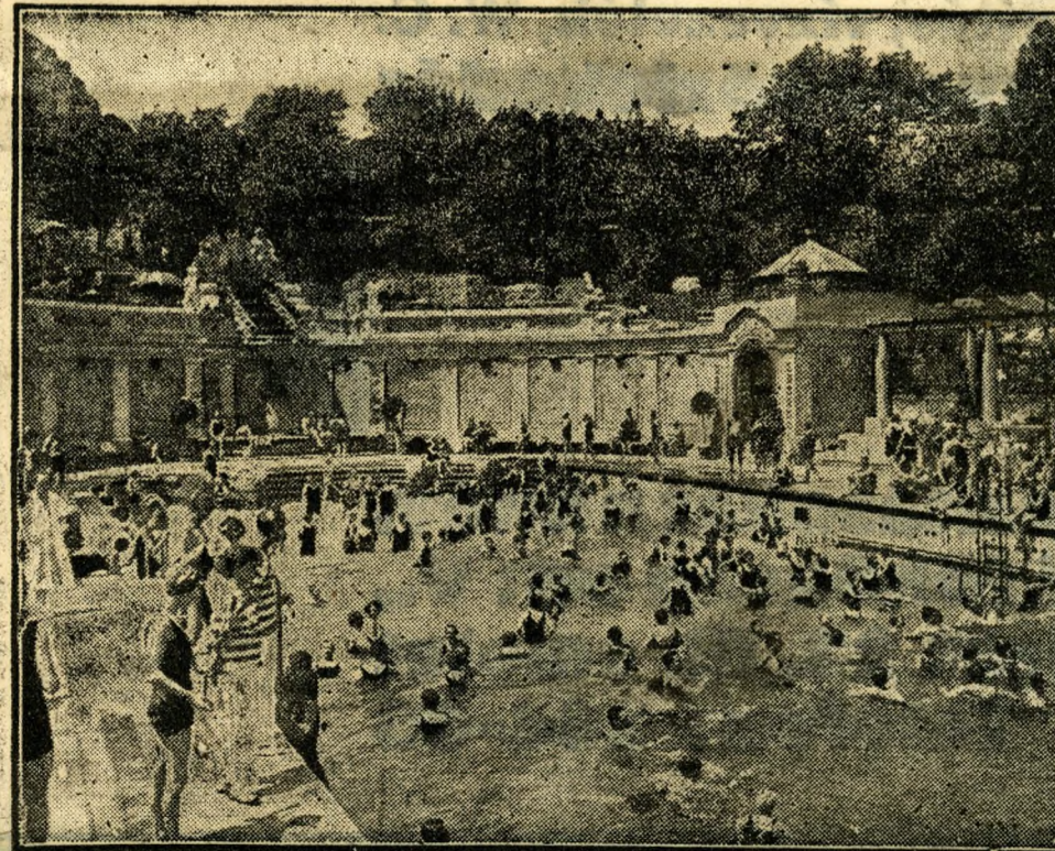
A Gellért hullámfürdője