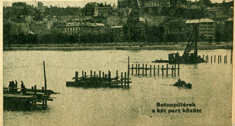
Betonpillérek a két part között