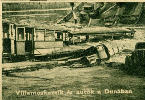
Villamoskocsi és autók a Dunában