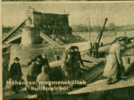
Néhányan megmenekültek a hullámárból

előtt küszködött az alámerülés ellen, amikor a propellerek feltűntek a Lánchíd felől és teljes gőzzel igyekeztek a szerencsétlenség színhelye felé. A hajószemélyzet derekas munkát végzett, egymásután emelték a csónakokba és a hajófedélzetre a hidrobbanás áldozatait.