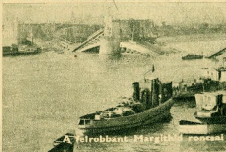
A felrobbant Margithíd roncsai

Egy szempillantás alatt jajveszékélések és halálsikolyok hallatszottak a Margithíd környékén. A drámai jelenetek egymást érték: a vízbezuhanó emberek tehetetlenül vergődtek a kavargó hullámokban, többen megpróbálták partra úszni, mások az úszó társzekerekbe kapaszkodtak. A villamosok belsejében rekedt utasokon pánik lett úrrá, egymást taposták le, az ablakokat törték ki, hogy meneküljenek a megfulladástól. A vízbezuhanóak egy része már a parlament