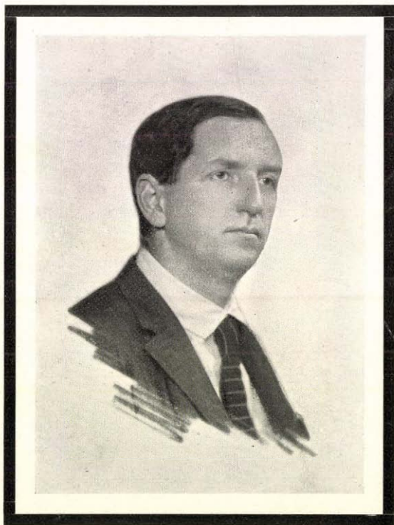
† D r KREMMER DEZSŐ 1879—1926