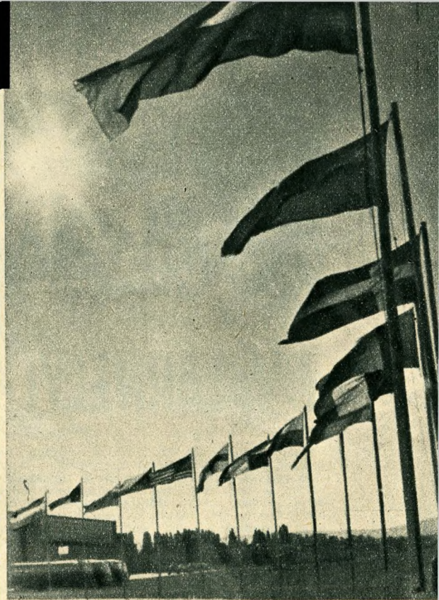
Befejeződött a világbajnokság. A nap lassan a felhőbe burkolódik, s tizenhét nemzet zászlója lobog, büszkén lobog...

után nagyszabású repülőbemutató következett. A pilóták szép