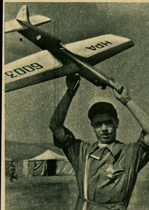
A belgák büszkesége, a műrepülő kategória világbajnoka: L. Grondal