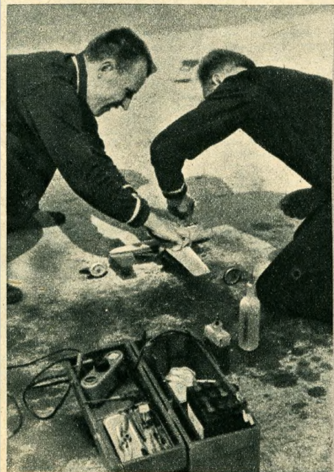
A szovjet versenyzők gyorsan ellátják üzemanyaggal gépüket. Sietni kell, minden másodperc számít