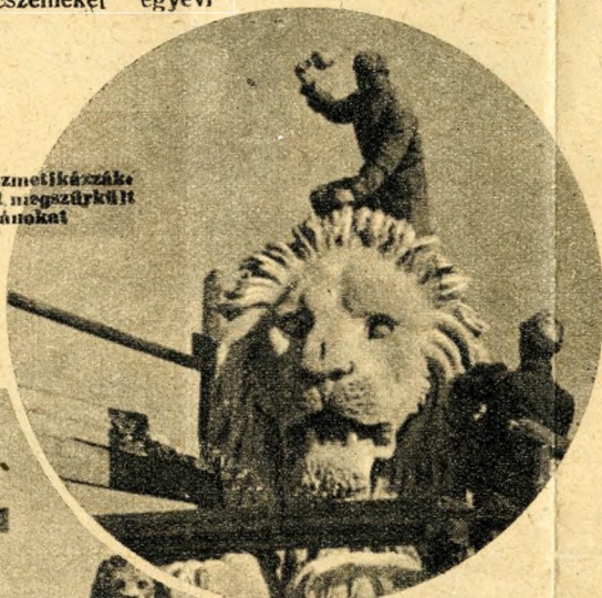
Hőféherre kozmetikázásuk a száz év alatt meggyűrűlt körorozslánokat

A gyártás mindenütt a tervezett határidő előtt fejeződik be,