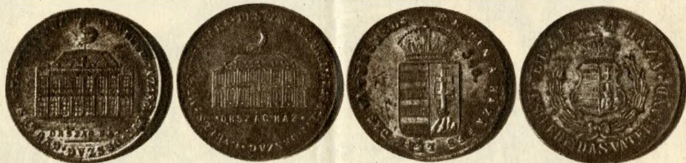
A régi képviselőház 1865 évi megnyitására kiadott emlékkeretek

Méltó helyet kap a Sándor-utcai épülettel a nagyhírű és jelentős kultúrmunkát végző Olasz Intézet. A magyar állam 1935-ben kötötte meg Itáliával a kulturális egyezményt s annakidején a kormányzó jelenlétében, díszes külsőségek között nyitották meg az intézet kapuit. A fővárosi központi szervén kívül az egész országban fiókintézetek működnek, amelyek a magyar—olasz kulturális kapcsolatok kimélyítése terén máris rendkívüli sikereket értek el. Debrecen, Pécs, Szeged, Kassa, Kolozsvár