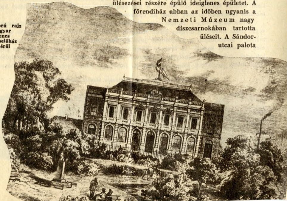
Egykorú rajz a magyar ideiglenes képviselőház épületéről

A Sándor-utcai régi képviselőház épületét Ybl Miklós építette 1865-ben. Az építkezés amerikai iramban történt, három hónap alatt tető alá húzták a képviselőház ülészései részére épülő ideiglenes épületet. A főrendiház abban az időben ugyanis a Nemzeti Múzeum nagy díszcsarnokában tartotta üléseit. A Sándor-utcai palota