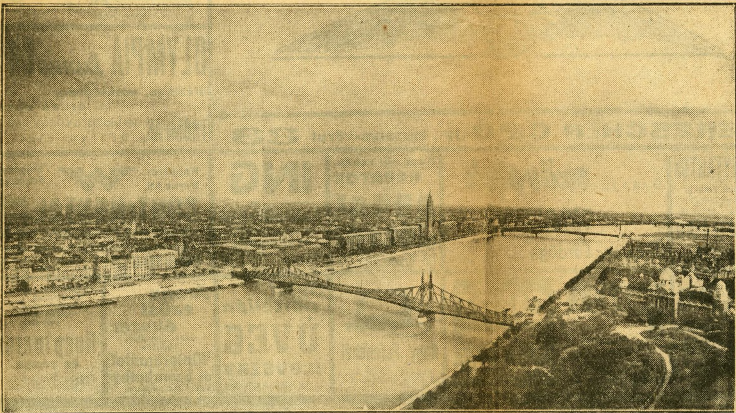
A Dunapart új látképe a városháza-terv megvalósítása esetén

2½ vagonos, tiszaparti gőzponton, nagy vasmalomszerű kerékesekkel. Tökeérés érdeklődők közvetlen ajánlatát kérjük: „Tiszaparti város” jellegre Leopold Cornél hirdetőjébe, Teréz-körút 1.