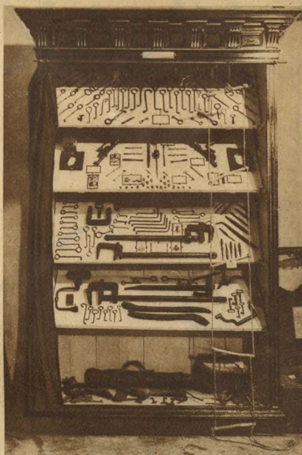
Kasszafúró és betörőszerszámok.

használták, tizenegyféle mérést kellett vele eszközölni, hogy a bűnözőről felvegyék a sajátossági adatokat. Természetesen, amióta a sokkal egyszerűbb és feltétlenül megbízhatóbb daktiloszkópiát bevezették, a Bertillon-féle mérőgép múzeumba került.