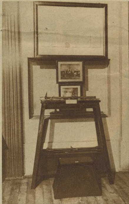
A Bertillon-féle testmérésgép, melyet a daktiloszkópia bevezetése előtt használtak a bűnözők csoportosításánál.

Egy nagyobb vitrinben s mellette valamivel távolabb egy asztalon a hamiskártyások szerszámai vannak kitergetve. Cinkelt kártyák, fekete szemüveg, melynek egyik részén alig észrevehető tükör van, hamis zsetonok és így tovább. A vitrinben egy igen furfangos szélhámos trükkjét is látjuk.