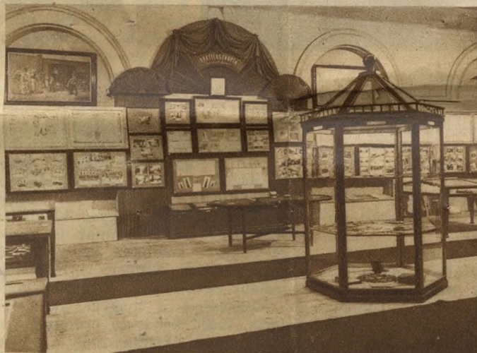
Ebben a vitrinben őrzik a nagyobb szélhámosságok bűnjeltek.

Igen érdekes, hogy miként került ez a «felszerelés» a bűnügyi múzeumba. Egy cigányzenésztől ellopták a pénzét a társai. Erre a zenész elhatározta, hogy visszaszerzi a «lovét». Gyenge testalkatú legény volt, nem mert ököltre menni velük, ezért elhatározta, hogy cselhez folyamodik. Egy fadarabból puskaagyat faragott, kakasnak egy eldobott szódásüveg szifonját rakta fel, bádogból csövet formált, fekete, kopott kemény kalapjába kakastollat tűzött és még arra is vigyázott, hogy az előírt derékszija is meg legyen, egy fekete rongydarabra, valamilyen csillogó rézdarabot rakott és így indult el társai felé, hogy visszaszeresse a pénzét. Azok a közelítő és felvillanó csendőrszuronyra megijedtek, az álcsendőr pedig már messziről kiabált, hogy az elrabolt pénzért jött. A társaság elmenekült,