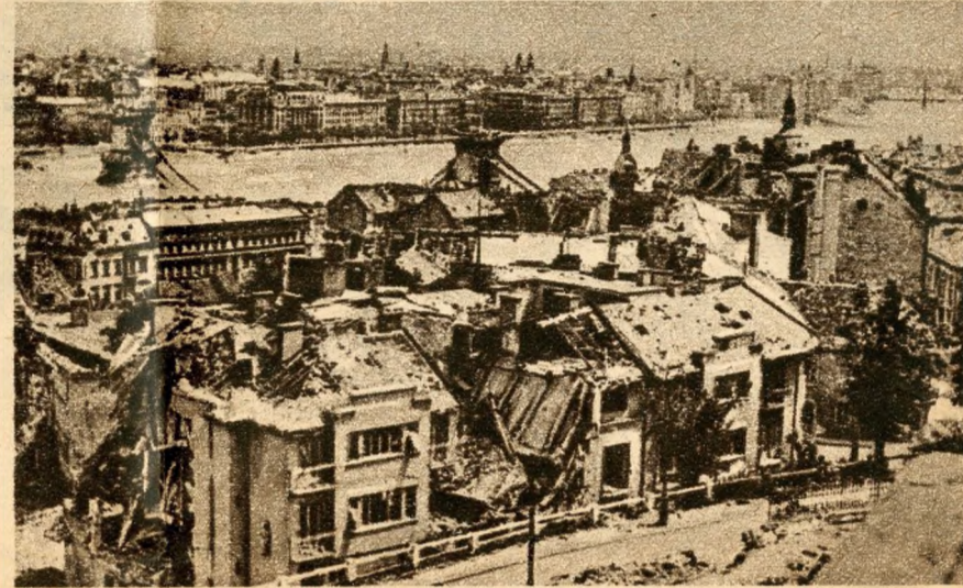
A Várhegy aljában, 1945...

A megtévesztett, becsapott nációk a Werbőczy-gimnáziumba összehívott haditanácsra is a Mészáros-utcai „parancsnokság” tisztjeit hívták meg. Azok pedig, amikor megtudták mi készül, járőröket küldtek ki, összeszedték a számontartott bujkáló honvédeket és villámgyors rajtaütéssel, rövid