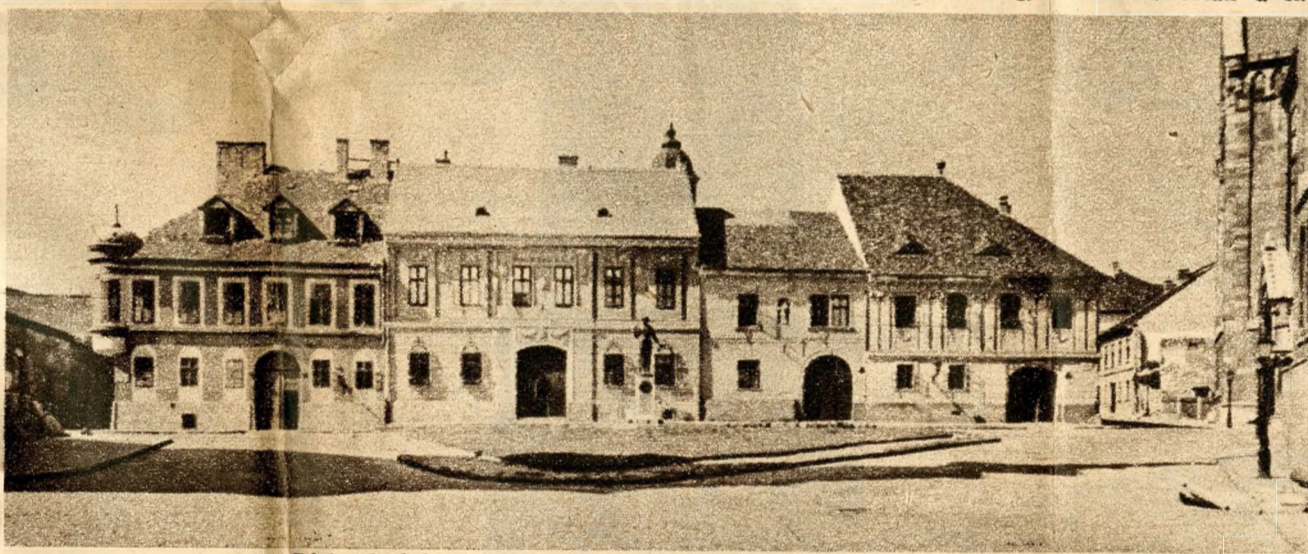
Régi szépségében áll már a Béciskapu-tér festőien színes, ódon házsora.