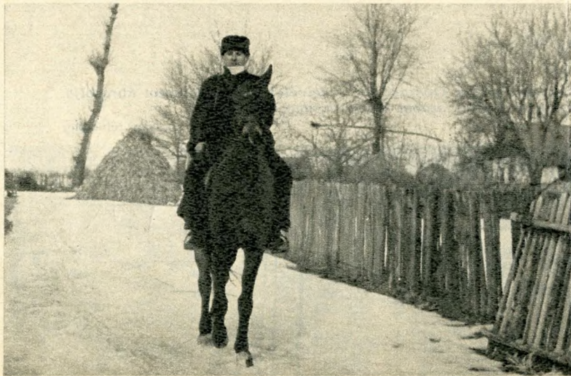
Lóháton viszi a szerencsét a falusi kéményseprő

Felragyog a szemünk, ha szembejön velünk a kéményseprő. Legyen gyerek, vagy idős férfi, fiatal leány, vagy tipegő néni, arra gondol ilyenkor, hogy valami jónak néz elébe. Újév táján különösen szívünkbe fogadjuk ennek a hányatott múltú iparnak derék dolgozóit. Sokan már csak azért is mennek szilveszterkor kávéházba, étterembe, hogy az új év első perceiben láthassák a kéményseprőt, megérintsék kormos ruháját és halmozva érje őket a szerencse, ha meghúzzhatják a visító kismalac farkát, amit seprő helyett tart a kezében és viszi körbe az asztalok között.