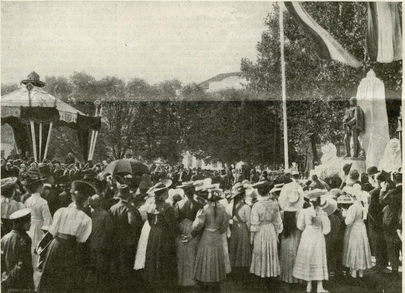
A KIRÁLY SZOBRÁNAK LELEPLEZÉSE KARÁNSEBESÉN, OKTÓBER 7-ÉN.