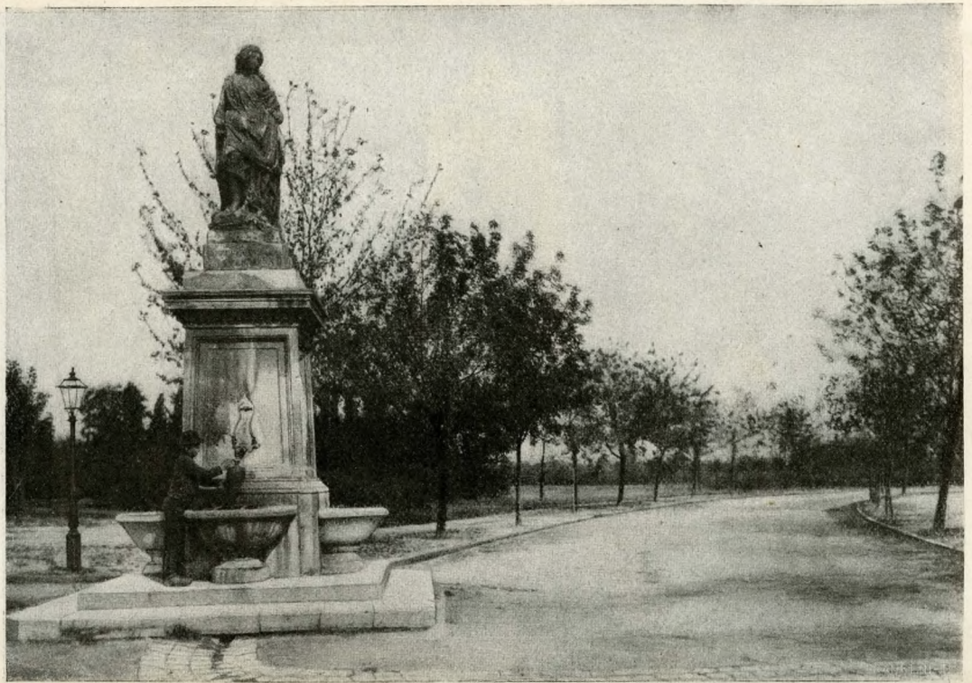
A HALÁSZ-KÚT A BUDAPESTI NÉPLIGETBEN.

Fényes paloták, ragyogó márványcsarnokok emelkednek ma már a főváros ez annyi könynyel, bűnnel fertőzött talaján, mely fölött mintha még ott lebegne múltjának valami ködszerű balladai árnya. A budapesti lakásinség áldozatai ma már elvonultak a Fehérvári-úti