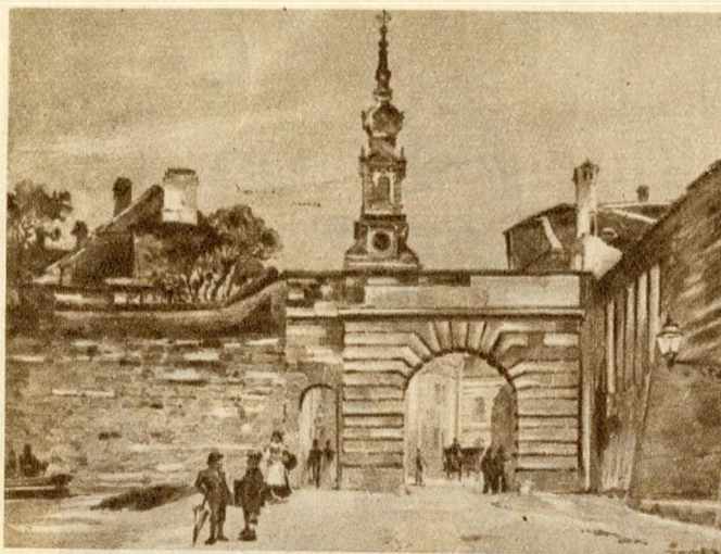
A Bécsi-kapu hajdan és most.

akkor emelvény állott, amelyen Mátyás és a kísérete foglaltak helyet és nézték végig a gyakran halálos kimenettelű párviadalokat. És itt egzecirozott a vasfegyelméről híres fekete sereg is.