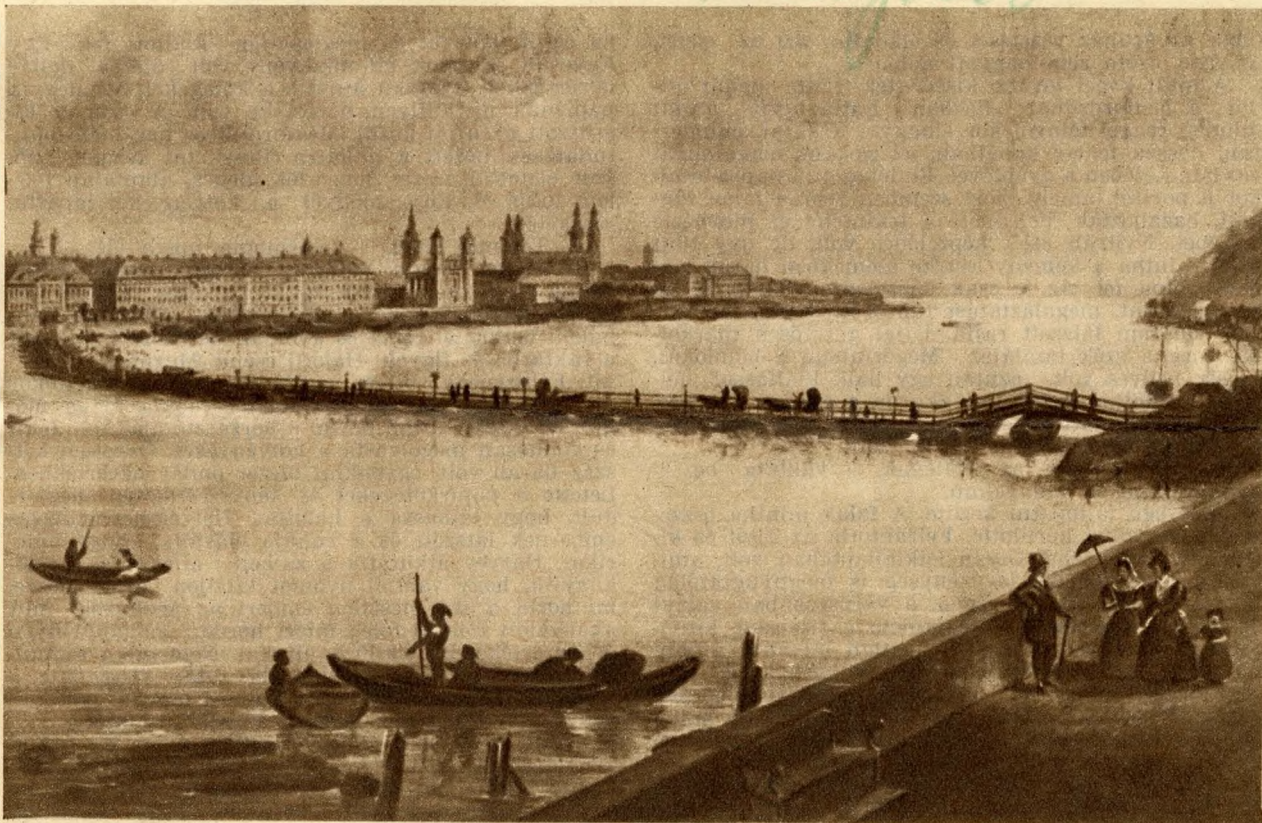
A Lánchíd őse, a pest-budai hajóhid.