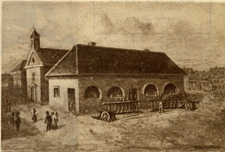
A honvédelmi minisztérium helyén gabonaraktár állt.

jött, szépen elsétált a hid közepe, hogy utat nyisson. A hajóhidat különben is csak nyáron lehetett használni, télen felszedték, hogy be ne fagyjon, így azután a jó budalak vagy pestiek várhattak tavaszig a vízítéssel, addig elzárta őket egymástól a Duna.