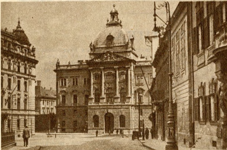
A honvédelmi minisztérium.

A mai honvédelmi minisztérium helyén ál- lott a csász. kir. várórség épülete. Rideg ka- szárnya volt ez, körülötte ágyuk ásítottak és szuronyos strázsa sétált föl-alá, rémitgetve a jó budai polgárokat. Még régebben, az oszt- rák uralom előtt, Mátyás király idejében itt, a mai Dísz-téren rendezték a fényes ünnepsé- geket és a lovagi tornákat. Ezért is maradt meg a neve: Dísz-tér. A minisztérium helyén