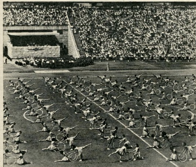
Tornagyakorlat az ünnepélyes megnyitón