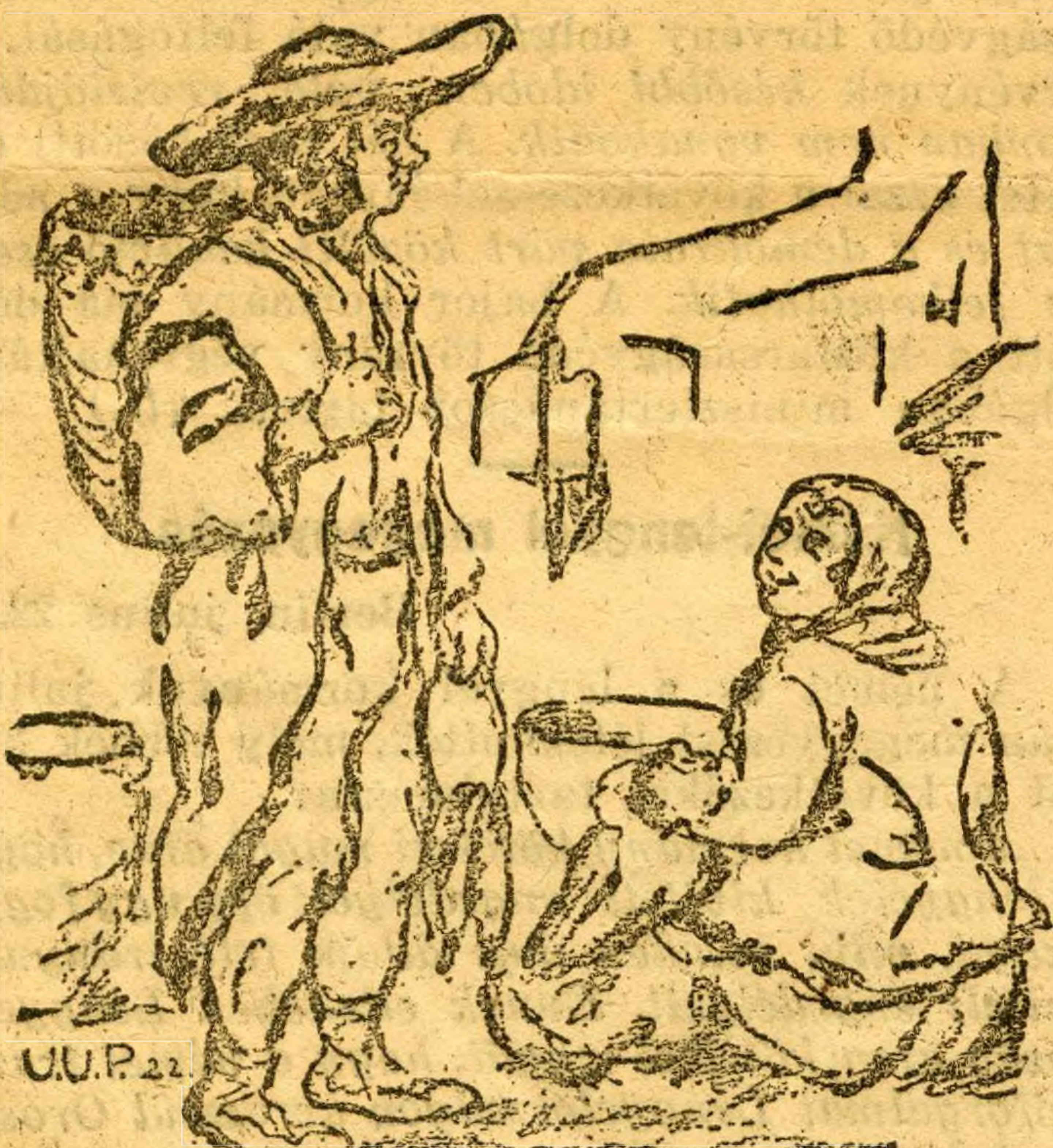
FENYŐMADÁR ÁRUS TÓT A RÉGI PEST PIACÁN.

Mennyivel szinesebb, tarkább és patriarchálisabb volt abban az időben ez az iramot vevő város. Mikor a varrókisasszonyok még Bus Vitéz beszélyeit olvasták s Podmaniczky báró ur regényein köny-