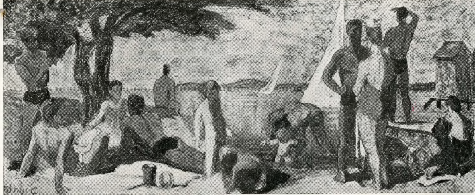
Fónyi Géza mozaikterve