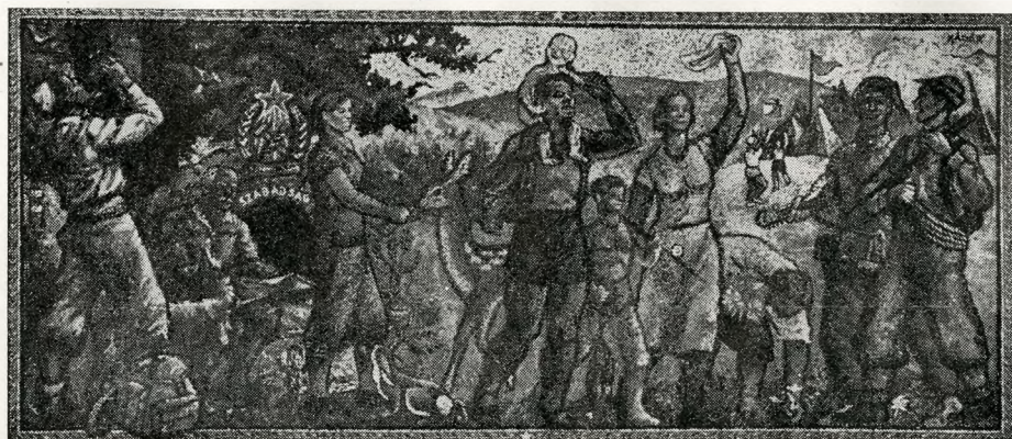
Kádár György mozaikterve