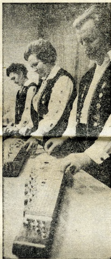
Citerazenével, népdalénekléssel tesz ki kellemessé az estét a Tamási Aron Röpülj Páva-kör tagjai.