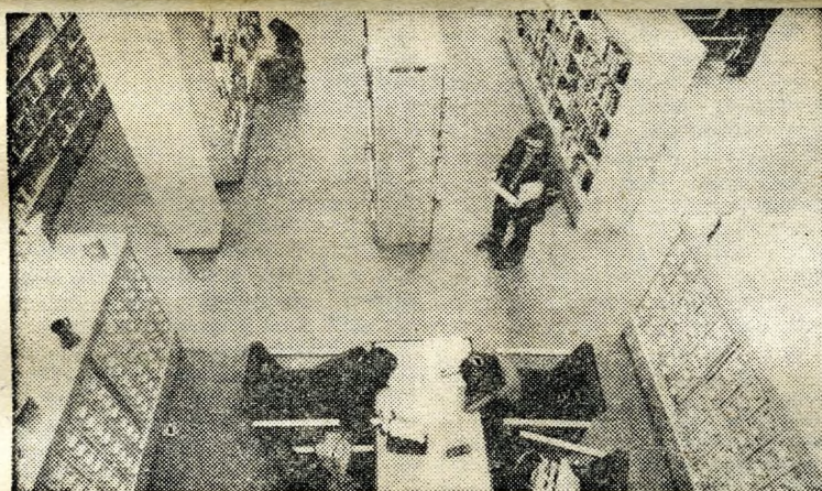
A tágas, csendes könyvtár 150 ezer kötettel csábít.