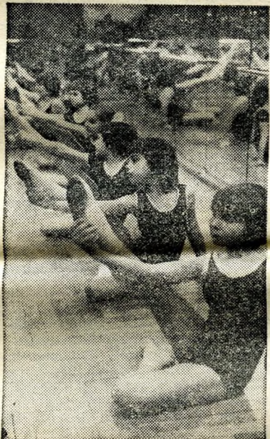
Ifjú balerinák a tükör előtt.