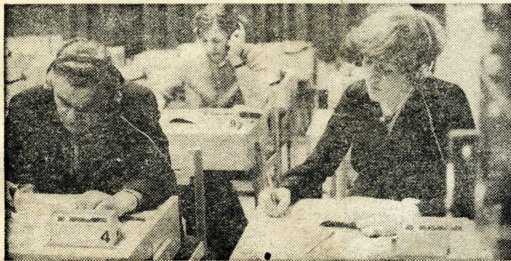
Harminchárom csoportban öt nyelvet tanulnak az audiovizuális terem látogatói.

Hiszen ők már tudják: a Pataký nemcsak megismerni és szórakozni, alkotni is hív.