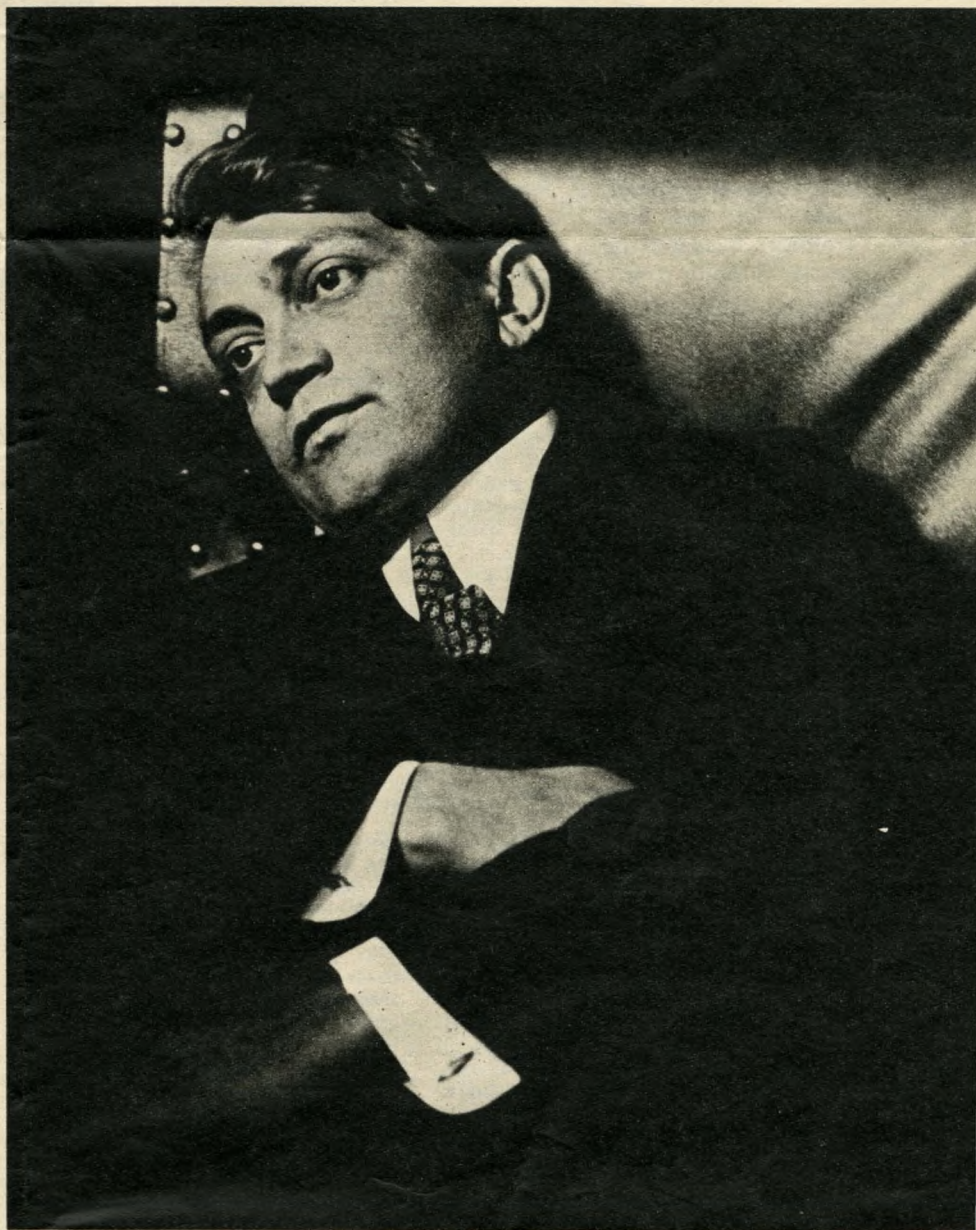
Ady-fotó Székely Aladár albumából

A militarizmus atrocitásai idején a szocializmus és a béke egyet jelentett Ady számára. A magyar gondokra való választ-váráson túl ez vonzotta Adyt a szocializmus eszméihez. Erről vallott, amikor a vilmosi Németország 1905-ben megtiltotta Jaurès-nak hogy Berlinbe utazzék: