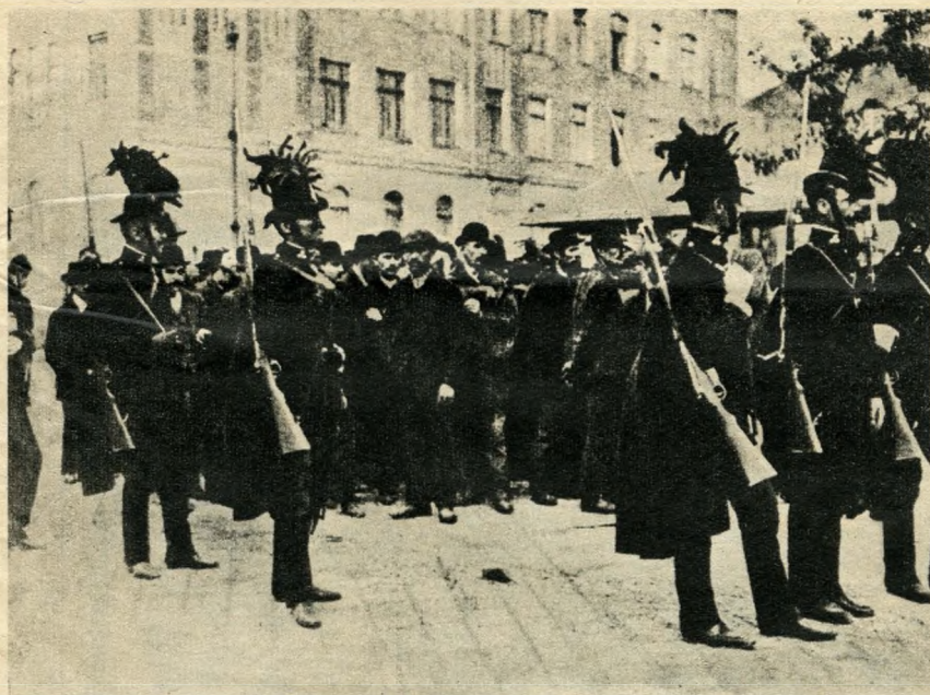
Tüntetés Budapesten, 1912. május 23-án

Egy igazán nagy szellem legjobban, leginkább megkülönböztető vonása, hogy mindig fölismeri korának jövőt idéző eszméit. Csokonai a falu rangú Debrecenben megértette, mit jelent a 18. századi európai magyarságnak a felvilágosodás; az Estve és a Marosvásárhelyi gondolatok ezért visszhangozták a forradalmat előkészítő nagy század, az enciklopédisták tanításait. Petfői egyszerre lelkesedett Heineért és Saint-Justért: a nemzetét párizsi emigrációjában ostromozó nagy német kortársáért és a jakobinusok legtávolabbra merészkező ideológusáért. Gazdag irodalmi múltunkról sorakoztathatnánk a példákat: hogyan tették magukévá éppen legnagyobbjaink koruk haladó gondolatát.