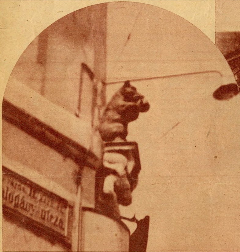
Medvét ábrázoló házcimer, melyről a Medve-utca nevét kapta