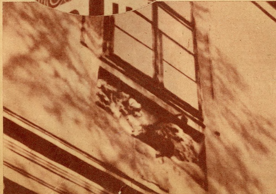
Iskola-téri „Sündisznóház” kb. 500 éves kapucimere. (Szerencsét hozó sündisznó)

„Kék golyó” ház-cimer, melyről a Kékgolyó-utca a nevét nyerte. (A vasárnaputáni borgőzös hangulatra utal, akár a „Blaumontag” kifejezés)