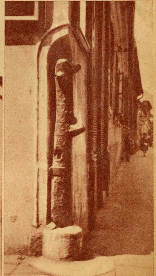
„Vastuskó” ház-cimer (Stock im Eisen) az Iskola-utcában