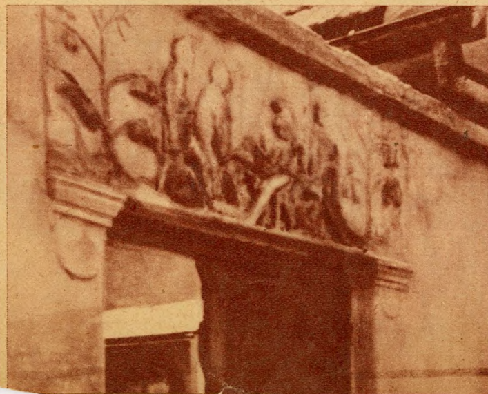
... kapucimer egy Kildás-utcai házon