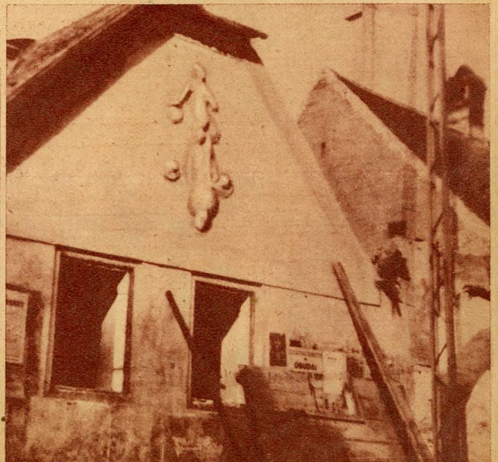
Nemrég lebontott Margit-köruti ház Szűz Máriás relieffel