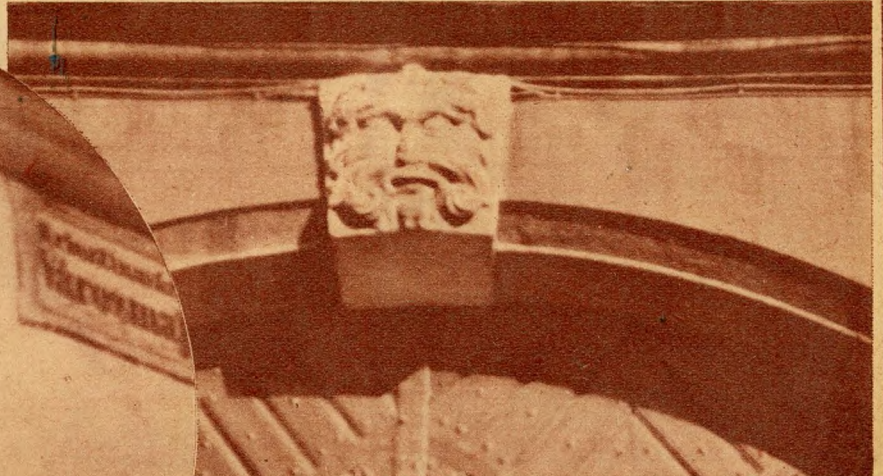
Szakállas zsidói ábrázoló kapucimer a Fortuna (ezelött Zsidó)-utcában, ahol a várbeli gettó volt.

„Kék golyó” ház-cimer, melyről a Kékgolyó-utca a nevét nyerte. (A vasárnaputáni borgőzös hangulatra utal, akár a „Blaumontag” kifejezés)