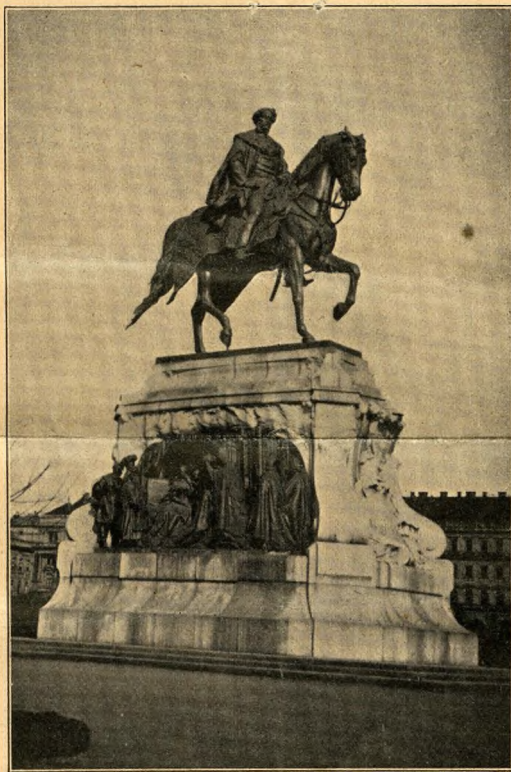
Standbeeld van Graaf Julius Andrássy voor het Parlements-gebouw.

Zoodoende ontbreekt bij zulke gelegenheden de schitterende Koninklijke stoet, maar daarentegen zijn het hier de afgevaardigden en de magnaten in hun veelkleurige, met edelgesteenten en pelswerk rijk bezette uniformen, die zich in hun eigen rijtuigen naar het