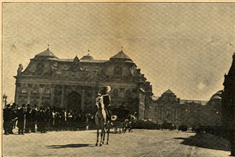
De afgevaardigden begeven zich per rijtuig naar het Koninklijk Paleis, om de troonrede te hooren.