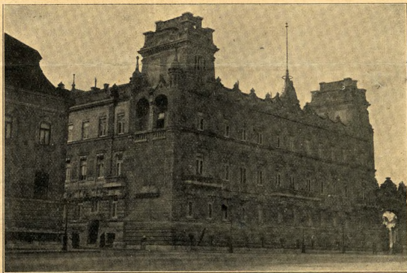
Het Paleis van Aartshertog Josef. (Naast het Koninklijk Paleis).