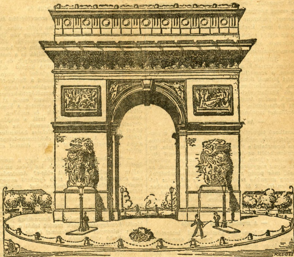
Az Arc de Triomphe a francia ismeretlen katona sírhantjával.

— Ami a nagyszabású emlékmű tervének megvalósítását illeti, úgy tudom, hogy Zichy Géza gróf elkészítette egy tervet, monumetális emlékmű tervét, amely a Gellérthegy főfrontján akarja elhelyezni ezt a nagyszabású és allegorikus szobor-csoportozatot. Magát a tervet nem ismerem és így azhoz nem szólhatok hozzá, kétszázötven azonban, hogy annak kivitele, ami körülbelül