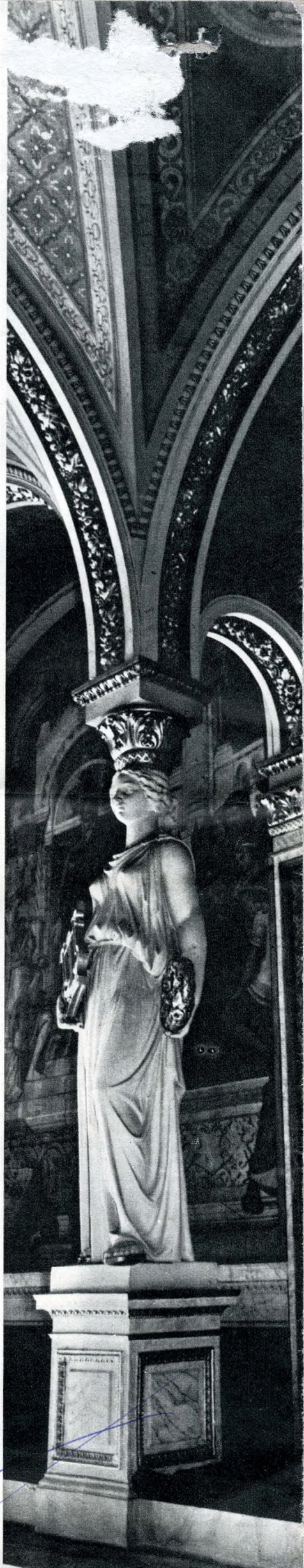
Részlet a díszteremből