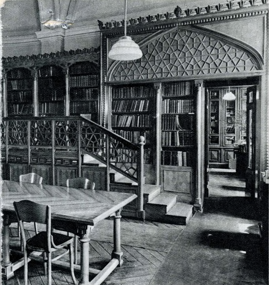
A Keleti gyűjtemények könyvtára