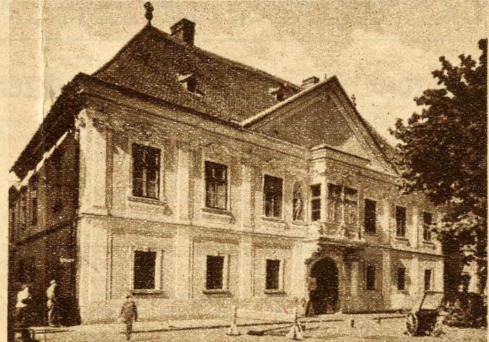
A győri „Apát urak házából” kitelepítették az üzleteket és az újjáépített palotában helyezték el a városi múzeumot

A sokat vitatott közlekedést úgy kellene megjavítani, hogy — a hűvösvölgyi mozgólépcső mintájára — a tönkrement Sikló helyén vagy másutt mozgólépcső vezetne a Várba.