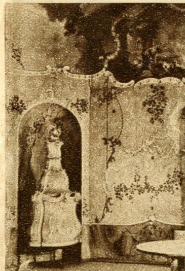
Az edelényi l'Hullier-kastély egyik rokokódíszes terméből — így választották le mellékhelyiségeket