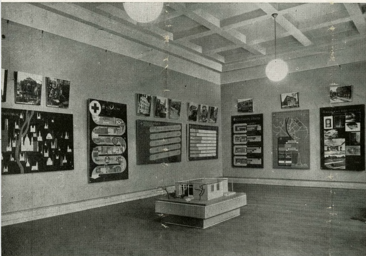
A kiállítás nagyterme