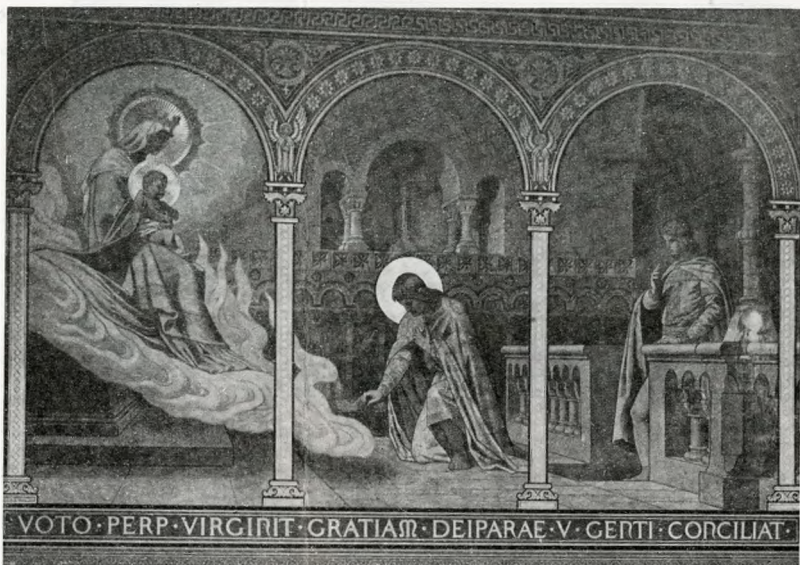
IL GRANDE PITTORE UNGHERESE BERTALAN SZÉKELY HA DIPINTO PER LA BASILICA DI PÉCS LA VISIONE DI SANT'EMERICO.

Nove secoli han fatto sì che il Principe ci venisse raffigurato ora come una fanciul-