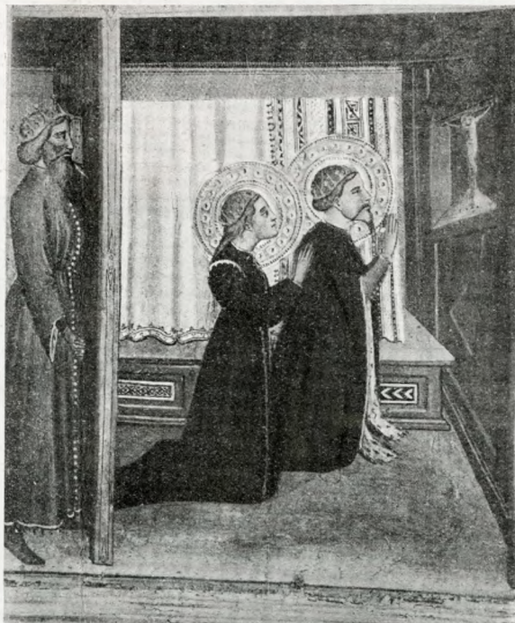
SANTO STEFANO, SANT'ILONA E SANT'EMERICO.