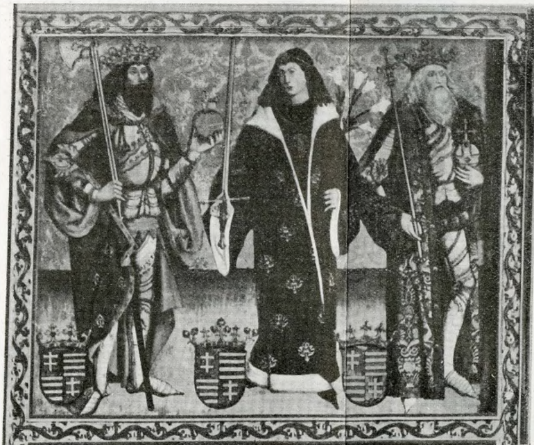
SAN LADISLAO, SANT'EMERICO E SANTO STEFANO NEL QUADRO SULL'ALTARE DI SZEPESHÉLY, SEC.XV.

Mentre Santo Stefano, primo re dell'Ungheria, resta e resterà il patrono del paese millenario, Santo Emmerico è il simbolo della gioventù ungherese, esempio di fortissima auto-disciplina, e segno di immortale e ardimentosa giovinezza. Perchè se nell'antico i pittori amavano ritrarre il Principe in atteggiamento mistico, taciturno, malinconioso, le nuove ricerche hanno dimostrato com'egli fosse invece giovane virile, cavalcante la pianura magiara per giorni e giorni dentro le vergini foreste piene d'insidie. Ed anche il voto, anche la conseguente rinuncia a gli amori terrestri, vicino alla sposa bellissima, debbono essere considerati come segni di una disciplina formi-