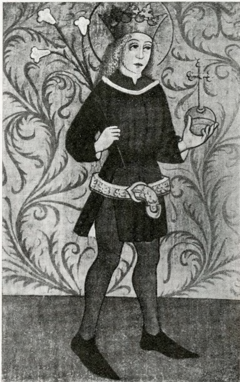
SANT'EMERICO IN UNA PALA D'ALTARE A CSILLAG-SOMLYÓ.

cappella di San Giorgio egli era intento alla preghiera, gli apparve un raggio di luce splendente