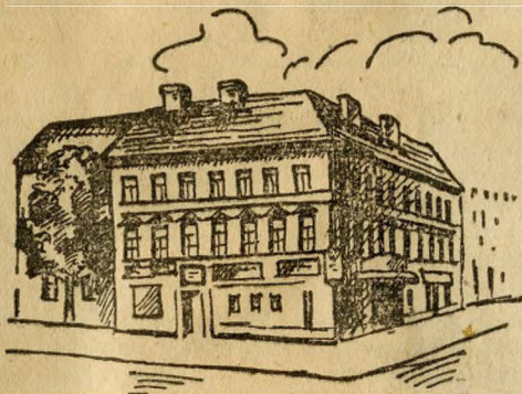
'A Kerepesi-utí ház, ahol Petőfi és Jókai lakott

erősnek hitt házak kátyavárként omlottak össze a Duna hömpölygő árjának nyomásával, a Harmincad-ház dacosan szállott szembe a hullámokkal és diadalmaskodott