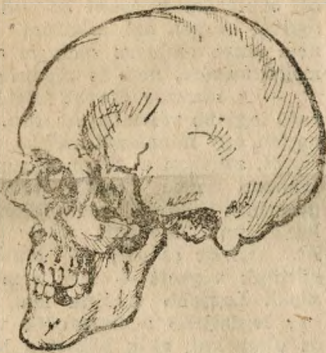
Martinovics Ignác koporsója

Poros akták között, elszárgult, pókhálós iratok társaságában hevernek a mártírhainvakat rejtő ládák, a szoba egyik sarkában, hármassával egymásfölé rakva. Rajtuk római számok. Az elsőtben Martinovics Ignác, a másodikban gróf Sigray Jakab, a harmadikban Hajnóczy József, a negyedikben Szentmarjay Ferenc, az ötödikben Laczkovics János, a hatodikban Szolaresik Sándor, a hetedikben pedig Oz Pál csontjai pihennek. Különös koporsók ezek, a még különösebb akta-sírboltban. Kilenc esztendő óta fekszenek itt, anélkül, hogy a kegyelettel megszentelt csontok visszakerülhetek volna az áldott anyaföldre. Hogy miért nem temették el eddig a vértanúk földi maradványait, arról azok tudnának beszélni, akik a városháza öreg falai között most minden kérdészködésre kitérő választ adnak, vagy mélysegesen hallgatnak. Magyar forradalmár-vértanúk méltó gyászünnepének rendezésére nem túlságosan alkalmas ma a hajdani Károly-kaszárnya szobáiban fülledő politikai atmoszféra s még komplikáltabbá teszi a kínos kérdést az a körülmény, hogy a szóbanforgó, lelakatolt ládákban pihenő forradalmárok egyike, Martinovics Ignác — apát. Valószínűleg azonban a főváros szűkös pénzügyi viszonyai is hozzájárultak az ünnepélyes temetés időtlen elhalasz-