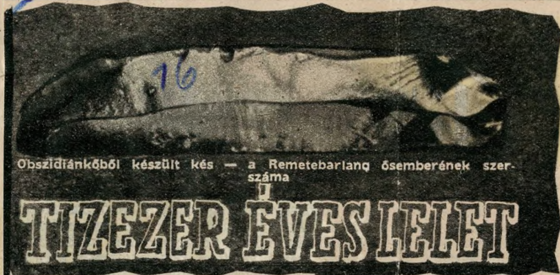
Obszidiánkőből készült kés — a Remetebarlang ősemberének szer- száma