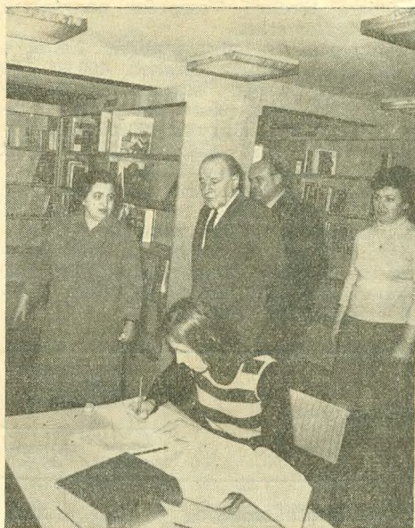
Kádár János látogatása a könyvtárban 1976-ban

A könyvtár napi látogatóinak száma 531, ez a magas szám a megyei könyvtárakéra emlékeztet (Veszprémben például 4—500), az olvasók mégis úgy oszlanak meg a könyvtár különböző részeiben, hogy nem keltik a zsúfoltság érzetét. 200 olvasó egyidejű jelenlétekor szinte üresnek tűnik a könyvtár.