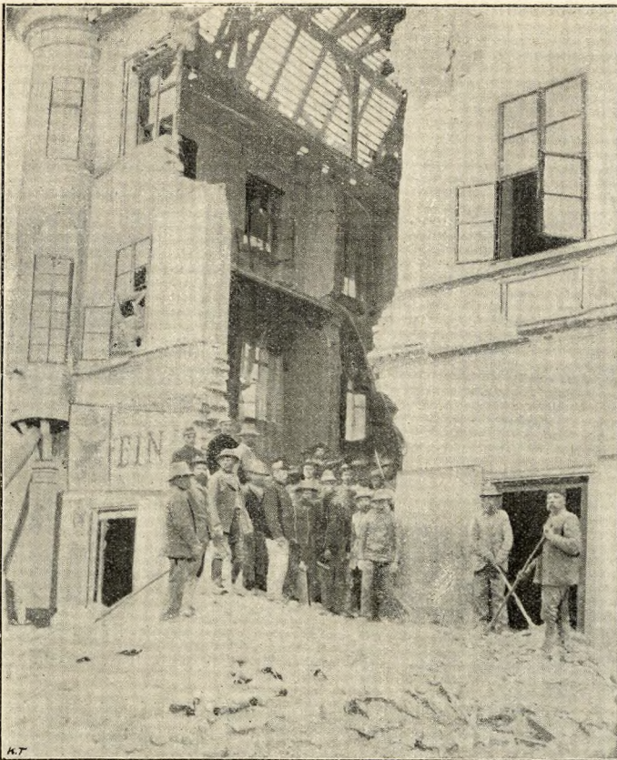
A bajai szerencsétlenség