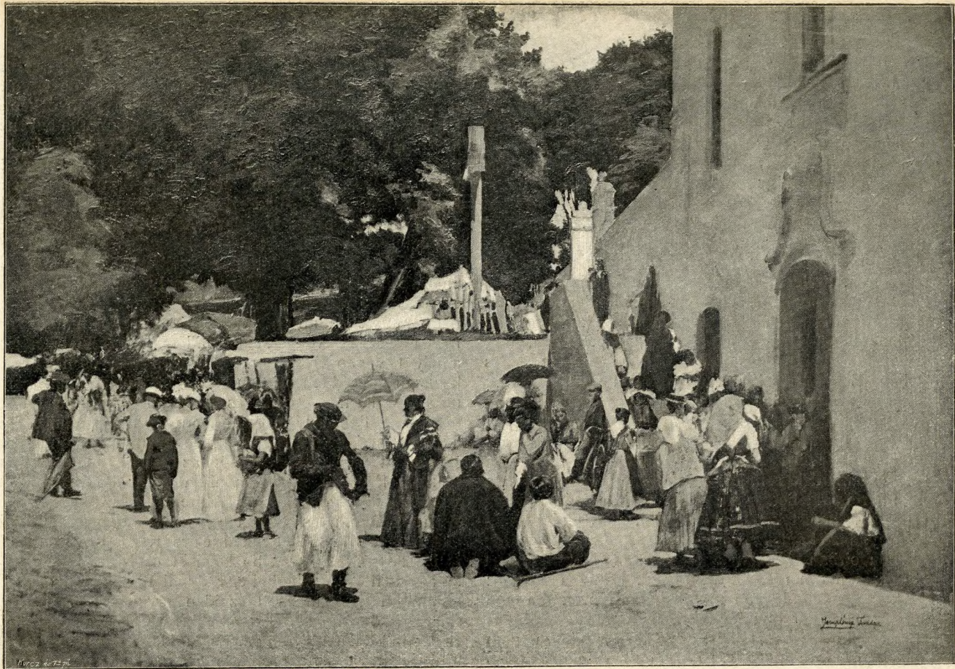
A Múcsarnok tavaszi tárlata