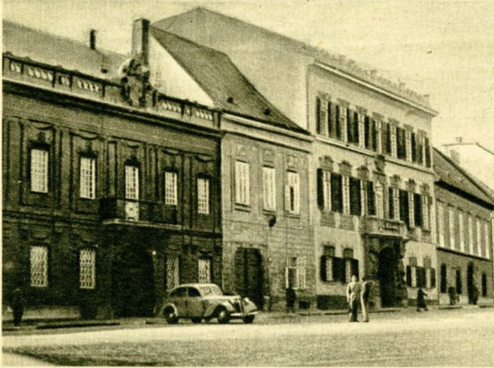
A Dísz-tér gyönyörű barokk palotái.