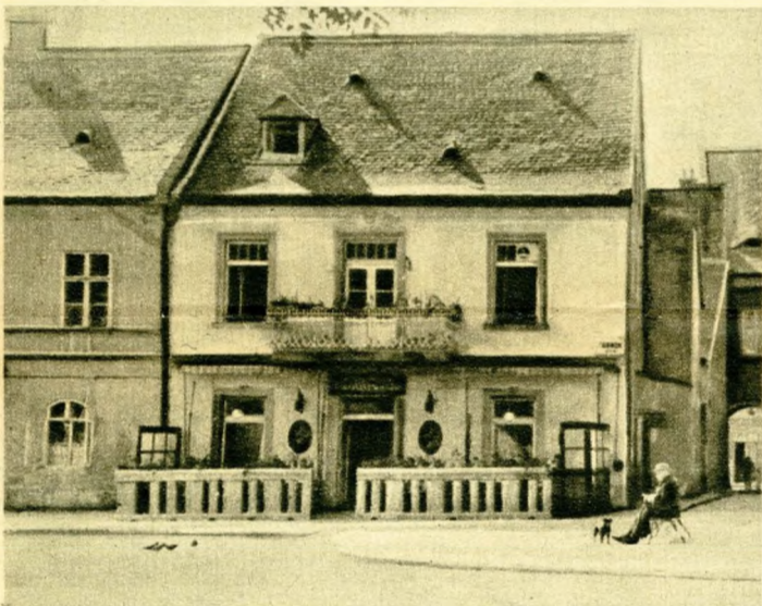
A tárnokutcai „Balta” vendéglő.