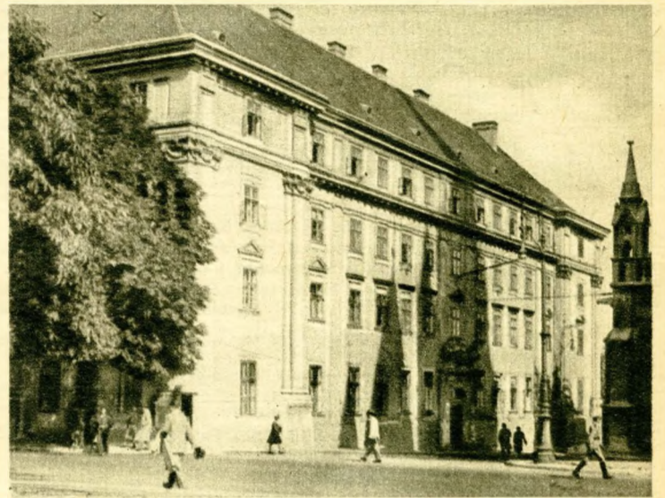
A klasszikus homlokzatú régi pénzügyminisztérium.