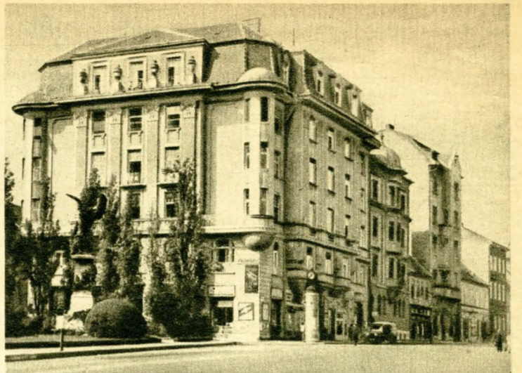
Az irdatlan sárga bérház, amely teljesen elcsúfítja a Dísz-teret.