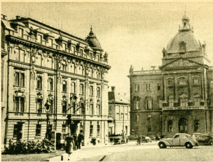
A külügyminisztérium palotája (baloldalt), amely erősen megbontja a Dísz-tér harmóniáját.