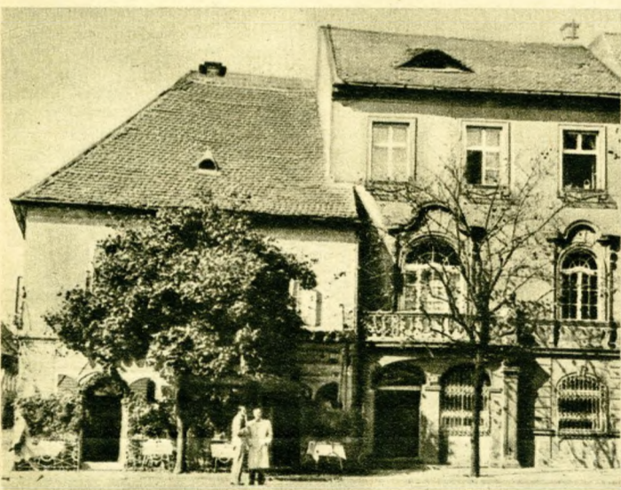
A „Fehér galamb” vendéglő a Szentháromság-utca sarkán. — Alsó kép: a Bécsikapu-tér nemesveretű régi háza.