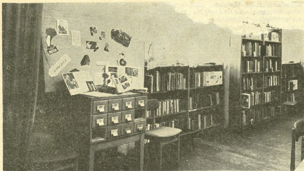
A Bartók-évfordulóról a Szabó Ervin kerületi könyvtárakban mindenütt megemlékeztek. Képünkön a 2. sz. könyvtár kiállításának részlete

mennyire tudunk a könyvtárosok kiválasztásában ezeknek az igényeknek megfelelni, ezt nagymértékben befolyásolják körülményeink. Az sem lenne meglepő, ha — mint ez a vitában is elhangzott — a Szabó Ervin kerületi könyvtárakban a zsúfoltság és a könyvtárosok hiánya miatt csak kiszolgáló munka folynék. S csak a könyvtárosok áldozatkészségének köszönhető, hogy ez a tevékenység gyakran lényegesen több mint „kiszolgálás”. Kétségtelen azonban, hogy a jelenlegi olvasószám és a feladatok további 145 könyvtáros alkalmazását tennék szükségessé.