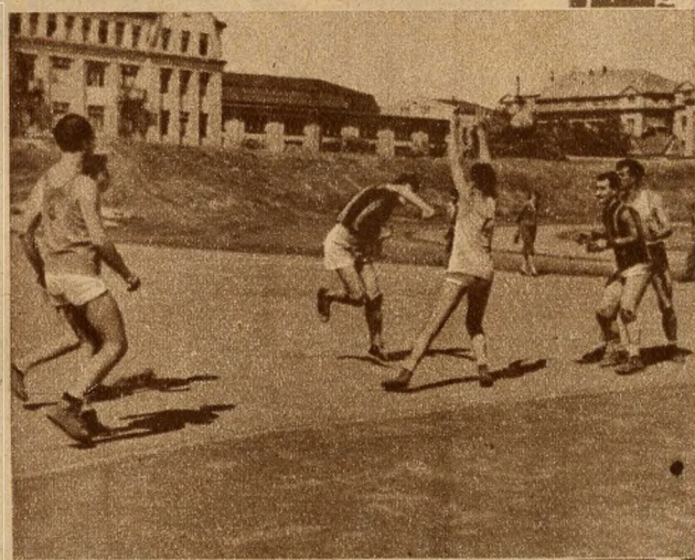
Vasas-KGM—Magyar Nemzeti Bank, Csikos mezben a KGM játékosai, akik 1960-ban megnyerték Budapest II. osztályú bajnokságát.