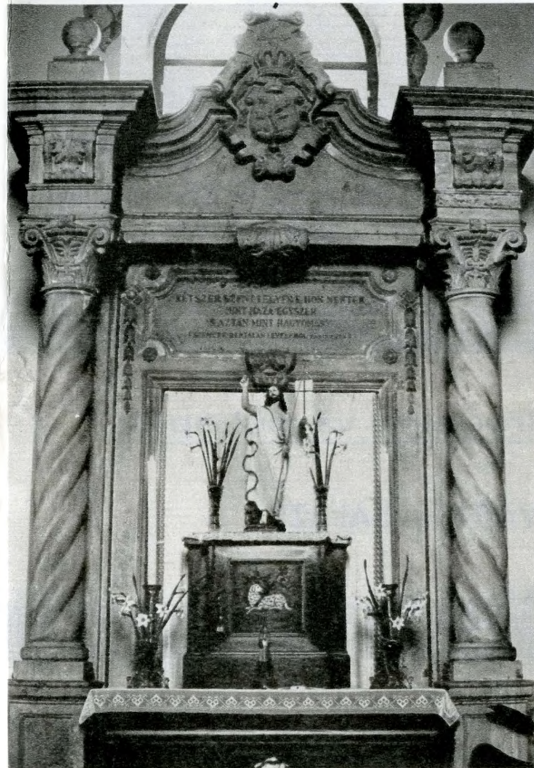
A pestlőrinci kápolna

— Kisgyerek voltam. Ötéves ha- lehettem. A konyhában gyakran megfordultam, és mindig kaptam valami kedvemre való falatot. Egy- szer a szobalány elvitt a Népligetbe. Odaálltunk a vásári fotográfus elé. Óriási kert volt. Fürdőmedence,