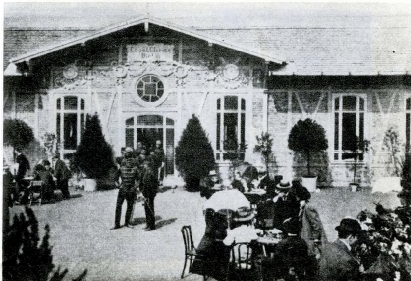
A lőtér bejárata a terrasszal

körül buzgalma évtizedek óta irányt szabott a sportág fejlődésének, és elsőként hozott dzsudó edzést — egyenesen Japánból — Magyarországra. A magyaros bajszot viselő Sasaki Kichisaburo, a sportágat alapító Kano mester egyik legjobb tanítványa 1903-ban érkezett Lőrincre, itt és a BEAC sporttelepén több mint egy fél évig tevékenykedett: az első magyar szakkönyv megírásában segédkezett, tanfolyamokon oktatott, vidéki bemutatókat tartott. Nem rajta és Szemerén múltott, hogy túl korainak bizonyult ez a próbálkozás, és a japán sportember elutazása után több mint negyedszázadig aludta csipkerózsa álmát a magyar dzsudó, hogy aztán a húszas években újra életre keljen.