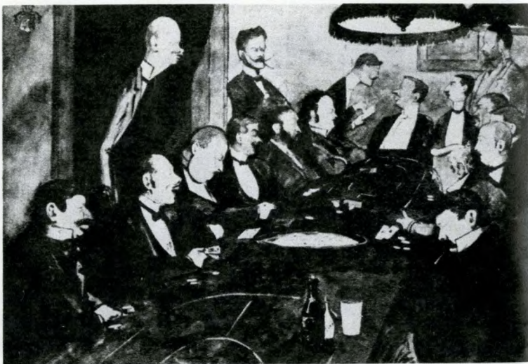
Szemere és a többi szerencsejátékos — karikatúra

(Szemere Miklós 1902. április 29-i képviselőházi felszólalásából)