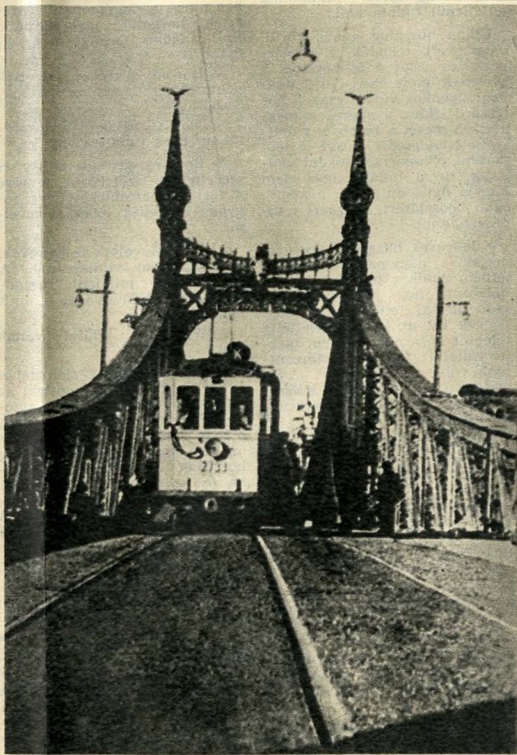
Átmegy az első villamos a Szabadság-hídon

A hídról jószerivel már csak olyankor olvashatunk, amikor valamiféle kozmetikai műveletre kerül sor az úttesten, a vaszerkezeteken. Egyéb újság? Semmi különös.