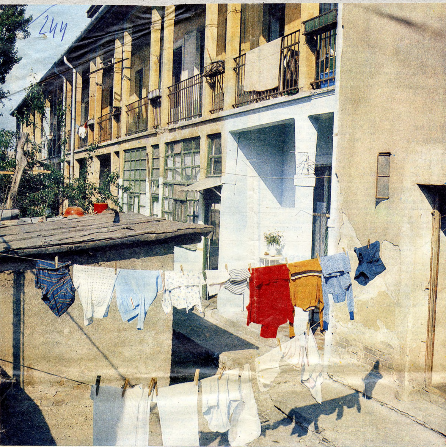
Lebontásra váró régi ház a Bihari úton