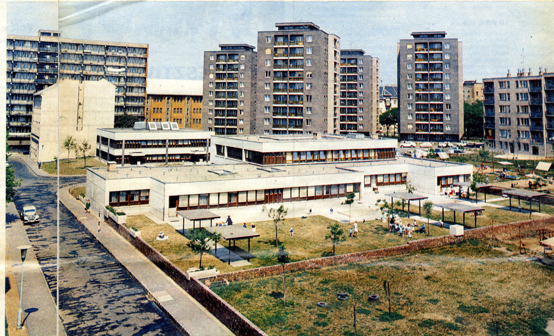
A Körösi Csoma Sándor úti lakótelep