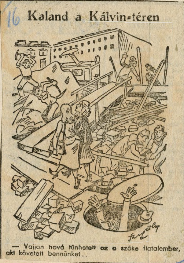
— Vajon hová tűnhetett az a szőke fiatalember, aki követett bennünket..

Gyors ütemben folynak a BSzKRT sínépítési munkálatai a Kálvin-téren és a Somogyi Béla-úton, ahol a Városházával szemben, az úttest közepén villamos pályaudvar létesül. Értesülésünk szerint a Kálvin-téri és Somogyi Béla-úti építkezések november végére befejeződnek és ekkor a Nagykörút után a Kiskörút is végig az úttest közepén közlekednek majd a villamosok. A Somogyi Béla-úti villamos pályaudvar elkészültével itt lesz a 48-as és a 89-es villamosok végállomása.