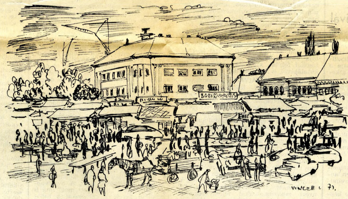
A kispesti Kossuth Lajos tér