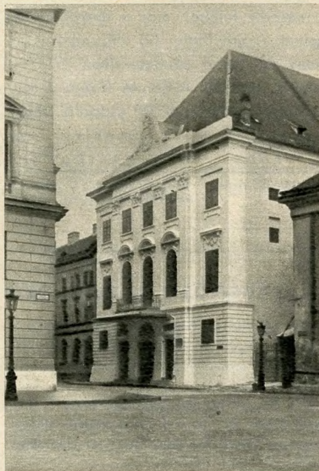
A budai Várszínház az 1930-as években

A lapok megírták, hogy Polinszky Károly művelődésügyi miniszterhelyettes sajtótájékoztatóján bejelentette: az új Nemzeti Színház építését 1967 első felében kezdik el és 1970-re fejezik be. A múlt héten hirdették meg a tervpályázatot, augusztusi határidővel, a színház elhelyezésére; és ezután írják ki az új színház épületére a nemzetközi pályázatot. A régi színház bontása a földalatti építkezésnek ütemétől függ, de felkészültek rá, hogy a társulatnak már 1965 elején költözködni kell.