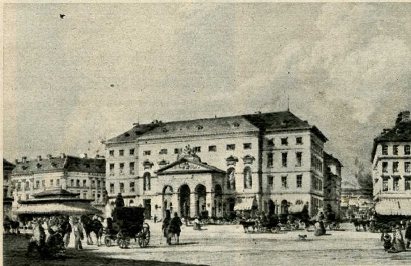
A pesti Német Színház homlokzata a valamikori Színház tér (ma Vörösmarty tér) felől, egy 1848. évi litográfián

terve szellemében, hanem a századfordulón beköszöntő klasszicizmusban készítette el Pollack Mihály 1808–12-ben. Épületének nagyobb volt a vonzereje, mint az öreg rondellának, melyet Déryné is csak »a dunaparti szárazmalom«-ként emleget.