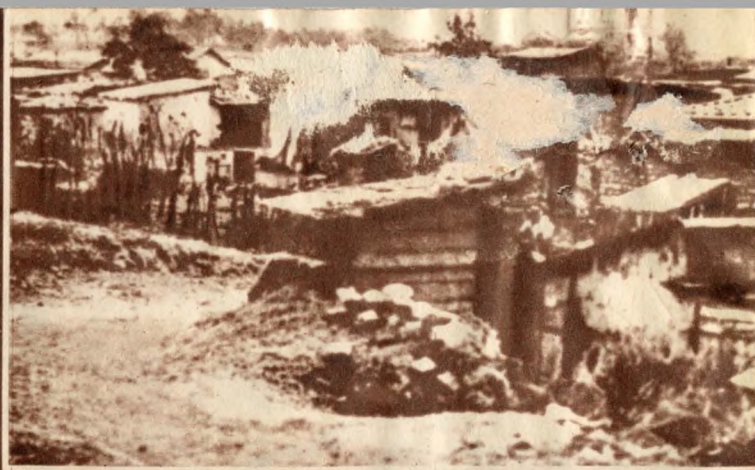
Harmincas évek: nyomortanyák a ferencvárosi kiserdőben