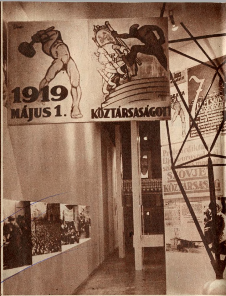
Két forradalom fővárosa: plakátok és képek 1919-ből