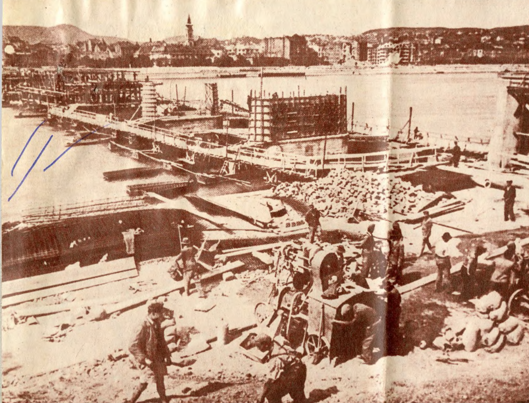
1945: az épülő Kossuth-híd képe a pesti hídfőről