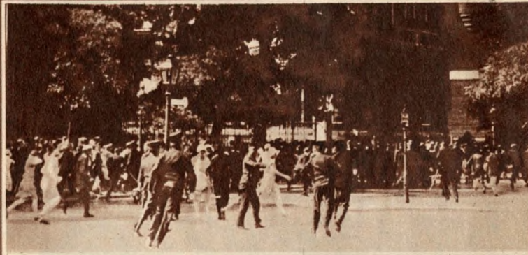
Rendőrroham 1930. szeptember 1-én