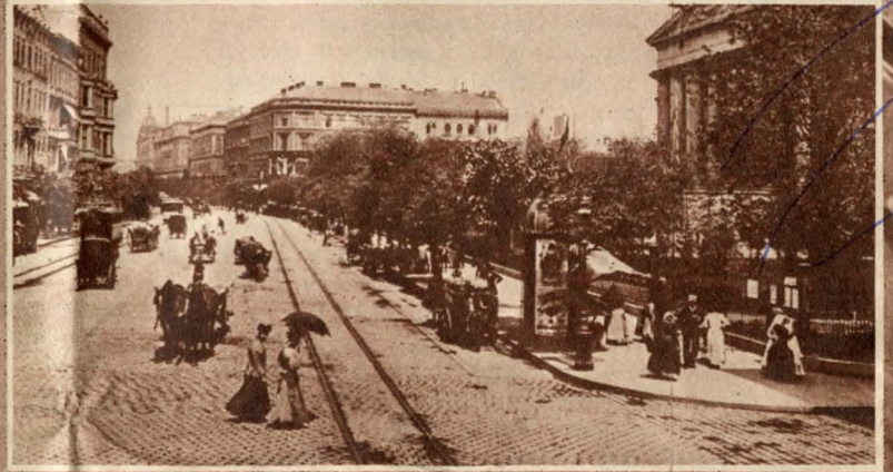
A Nemzeti Múzeum és a Múzeum körút a század elején