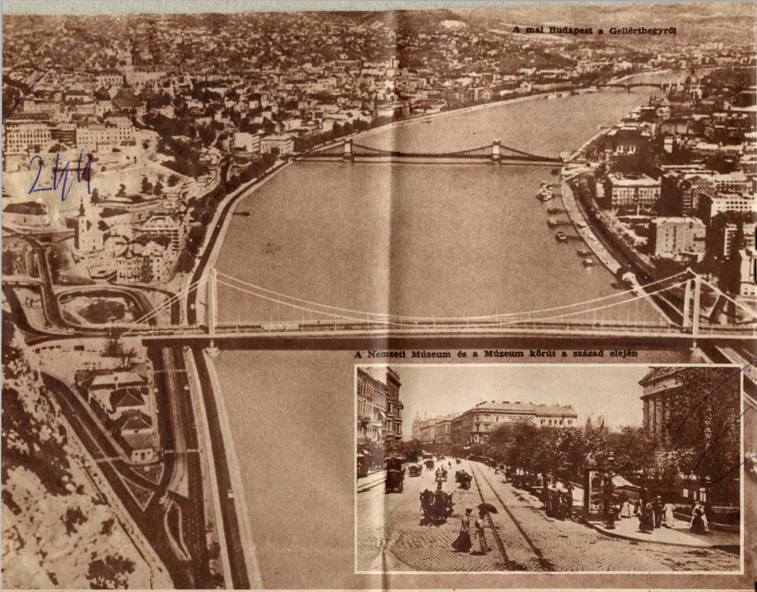
A Nemzeti Múzeum és a Múzeum körút a század elején