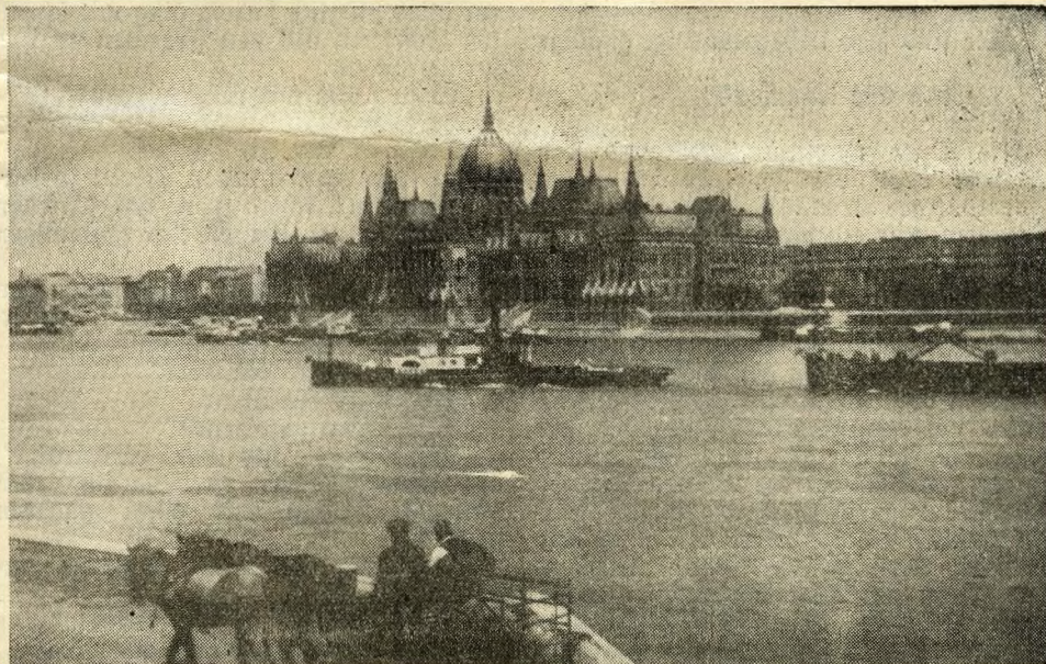
Budapests Parlament, das größte Parlamentsgebäude Europas

Margareteninsel! Sie ist weltbekannt, jene ruhige, herrliche Insel in der Donau. Und man ist wirklich nicht enttäuscht. Trotz der eleganten Cafés und Restaurants atmet sie eine wunderbare, wohlthuende ländliche Ruhe. Man spürt nichts von dem pulsierenden Leben und Treiben der Großstadt. Das alles scheint irgendwo weit weg zu liegen.