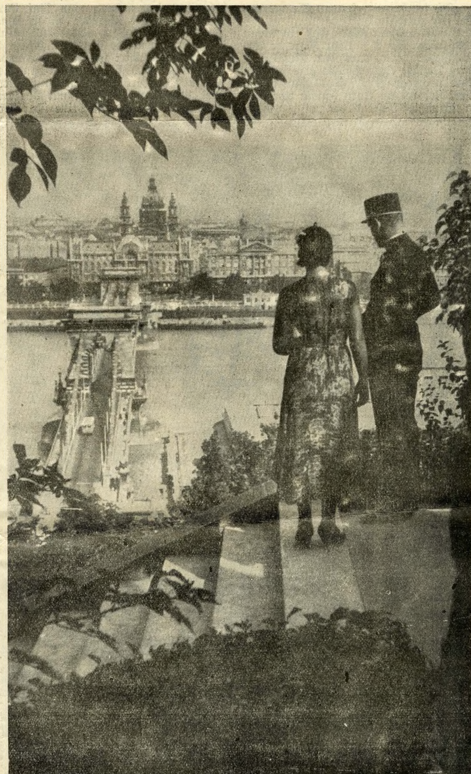
Wie in der Operette: Der junge, fescche Honvedleutnant mit seiner Braut auf der königlichen Burg