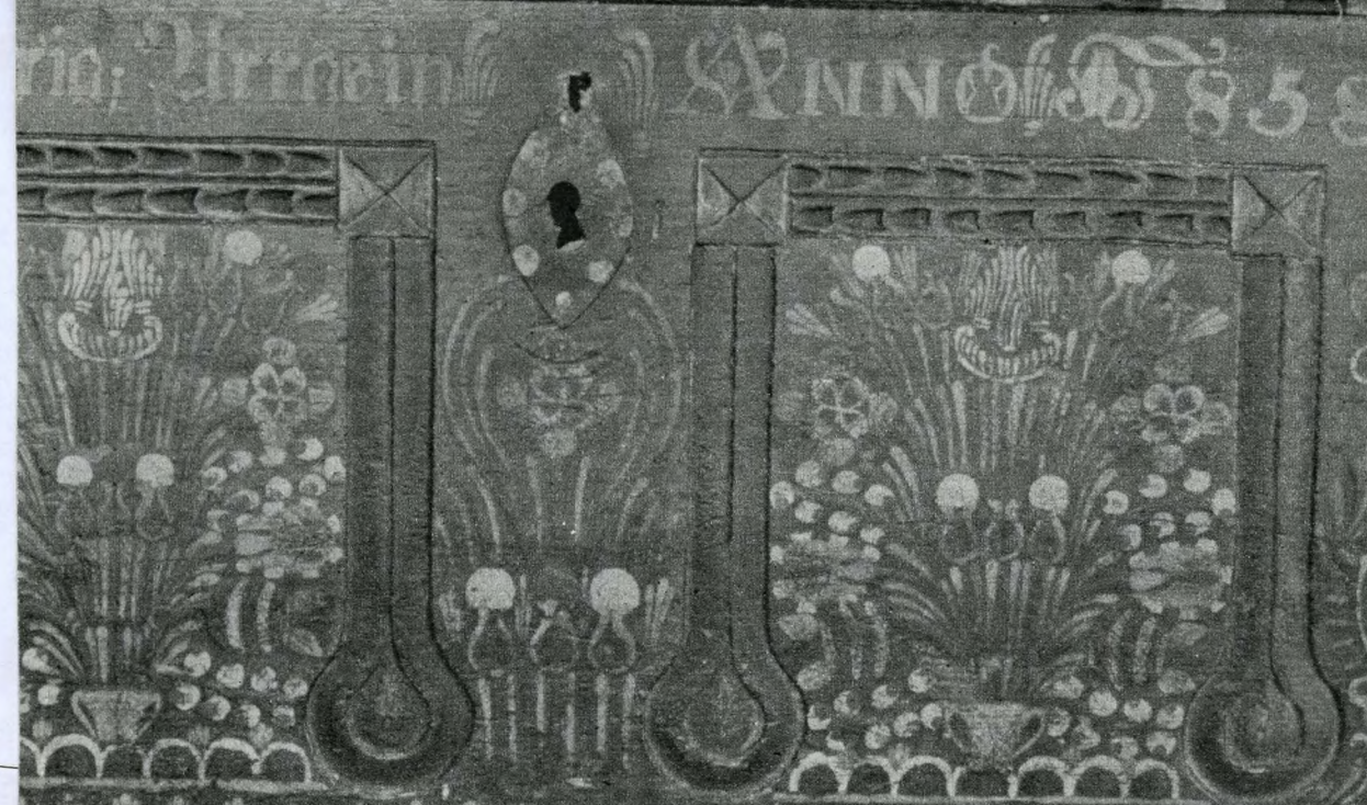
Komáromi láda, rajta baranyai szőttes és hódmezővásárhelyi boros-butykos