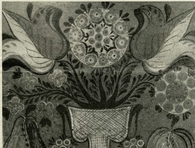
Kalotaszegi gránátalmás díszítésű láda (részlet)