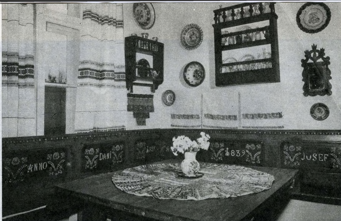
Sárközi sarokpad, XVIII. századi kamarás-asztal, falitékák