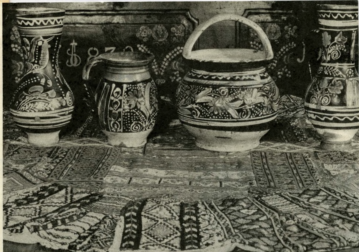
Nógrádi főkötőkből összeállított terítők tordai bokályok, kancsók