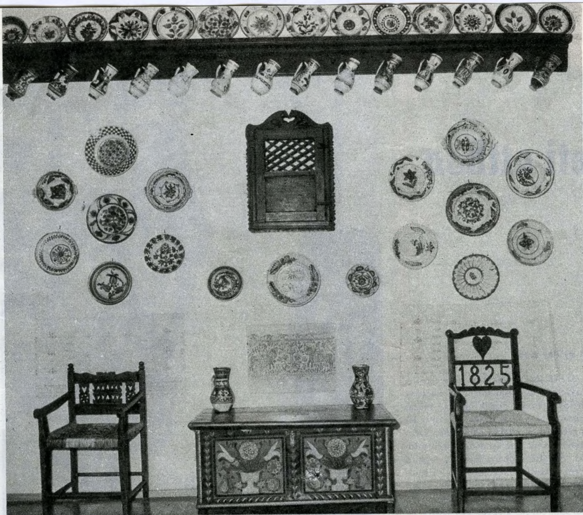
Az erdélyi fal